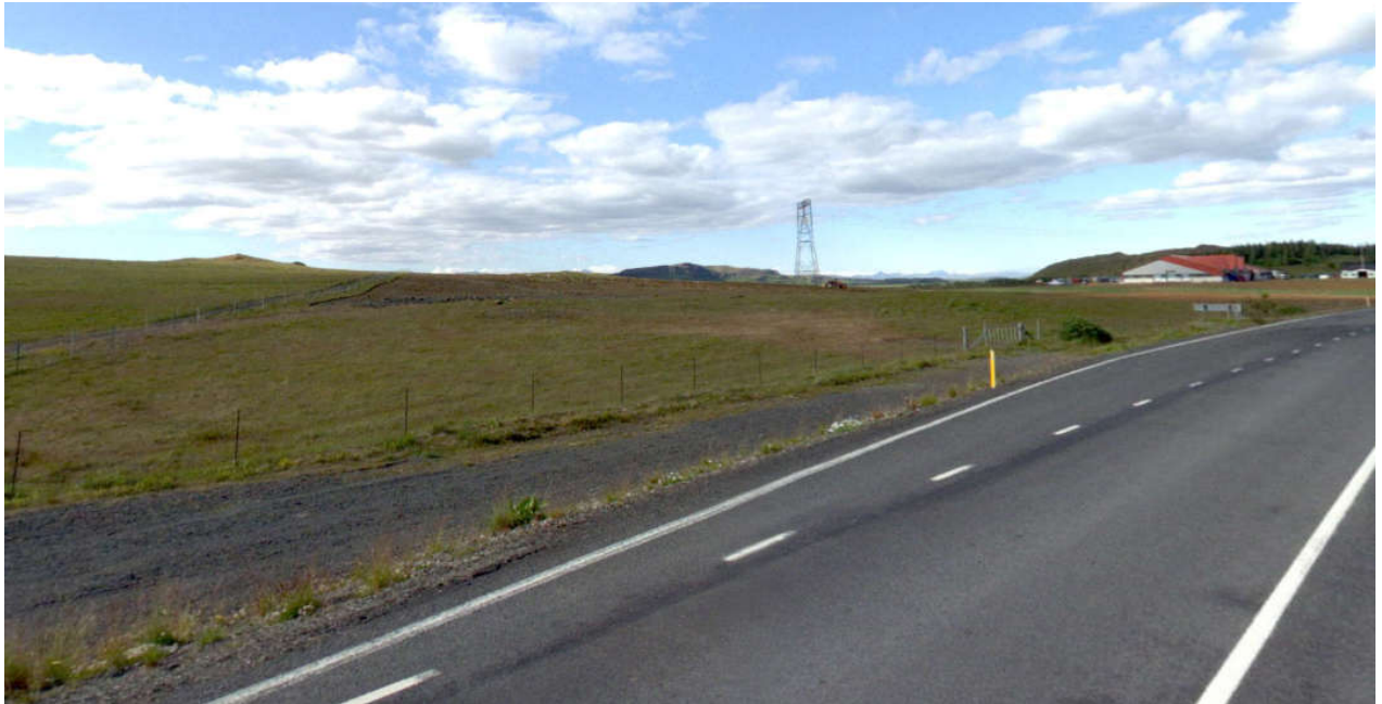
MYND 1. Fyrirhugað þjónustusvæði – (mynd: ja.is)

Með gerð deiliskipulags verða settir út byggingareitir/lóðir og skipulagsskilmálar fyrir þá.