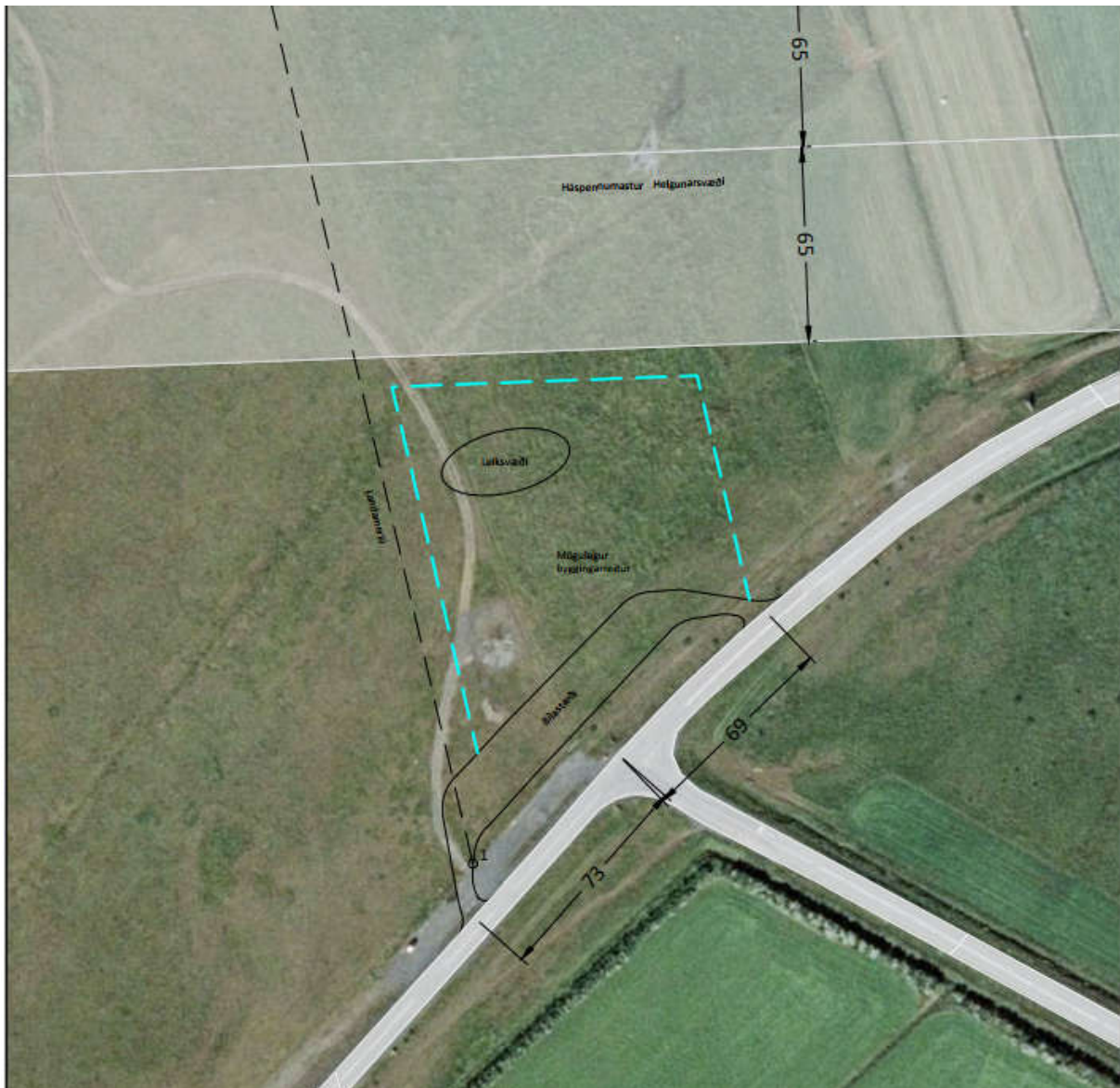
MYND 2. Loftmynd sem sýnir fyrirhugað svæði og aðkomu að því frá Skeiða- og Hrunamannavegi.

Í landsskipulagsstefnu 2015-2026 kemur fram að skipulag sveitarfélags miði að því að styðja og styrkja samfélag viðkomandi byggðarlags. Gæta skal að hagkvæmni varðandi samgöngur og veitur og byggð skal ekki ganga að óþörfu á svæði sem henta vel til ræktunar eða eru verðmæt vegna náttúruverndar.