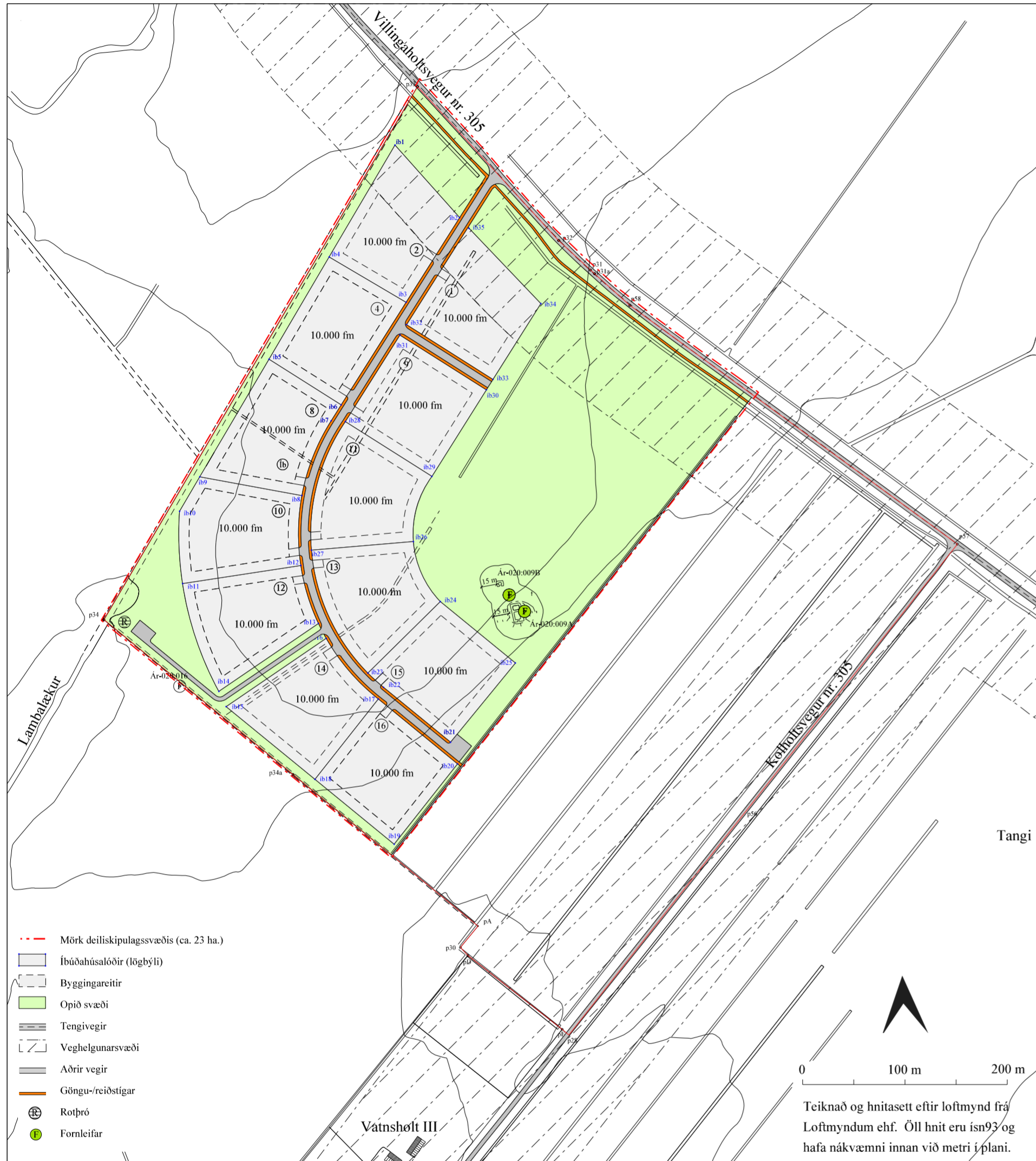
Deiliskipulag mkv 1 : 4.000 (A2)