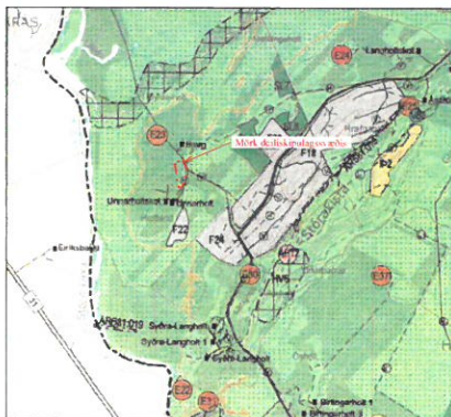
Hluti úr Aðalskipulagi Hrunamannahreppi 2016-2032.