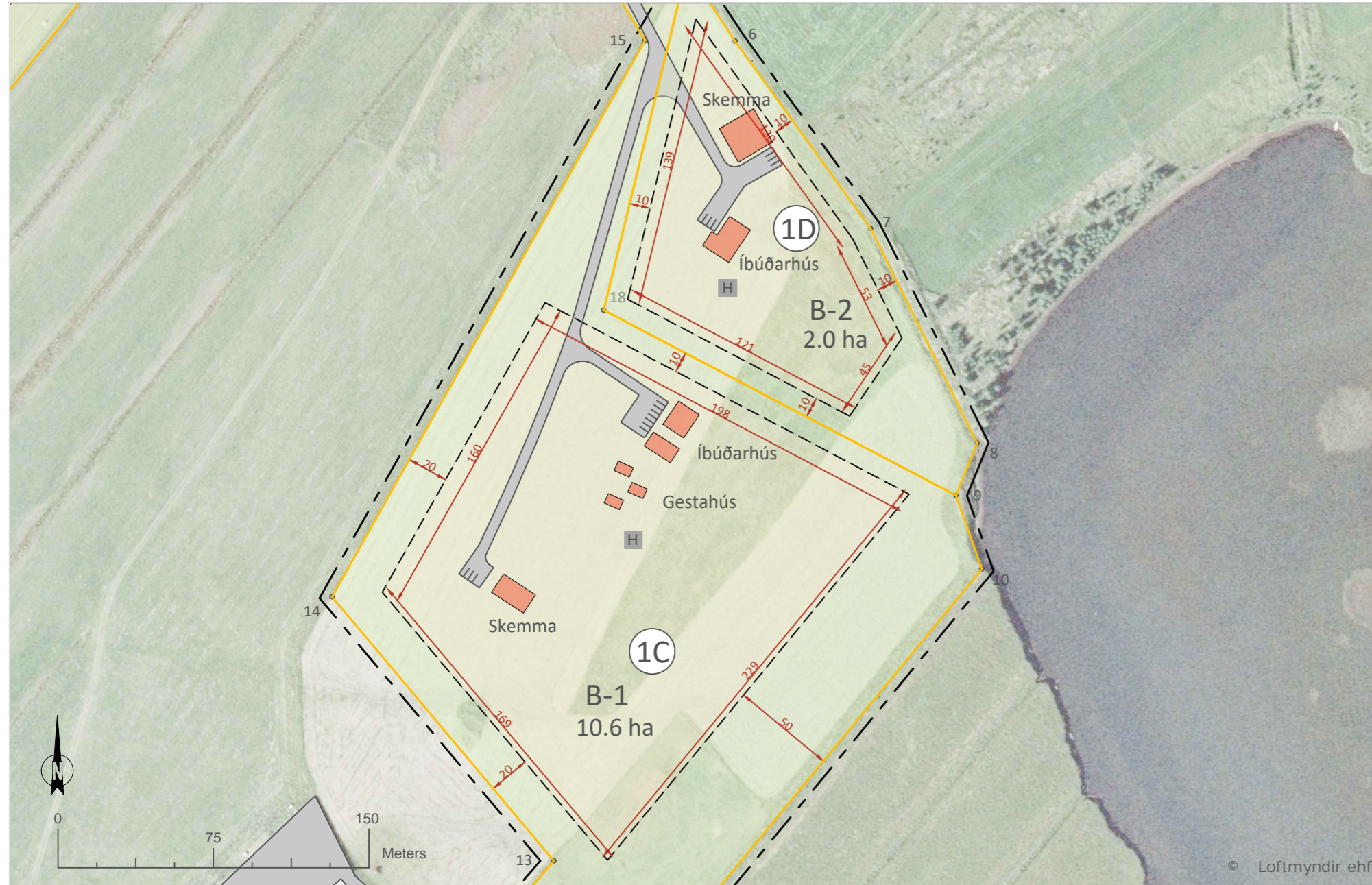
Deiliskipulagsuppráttur í mkv. 1:2500