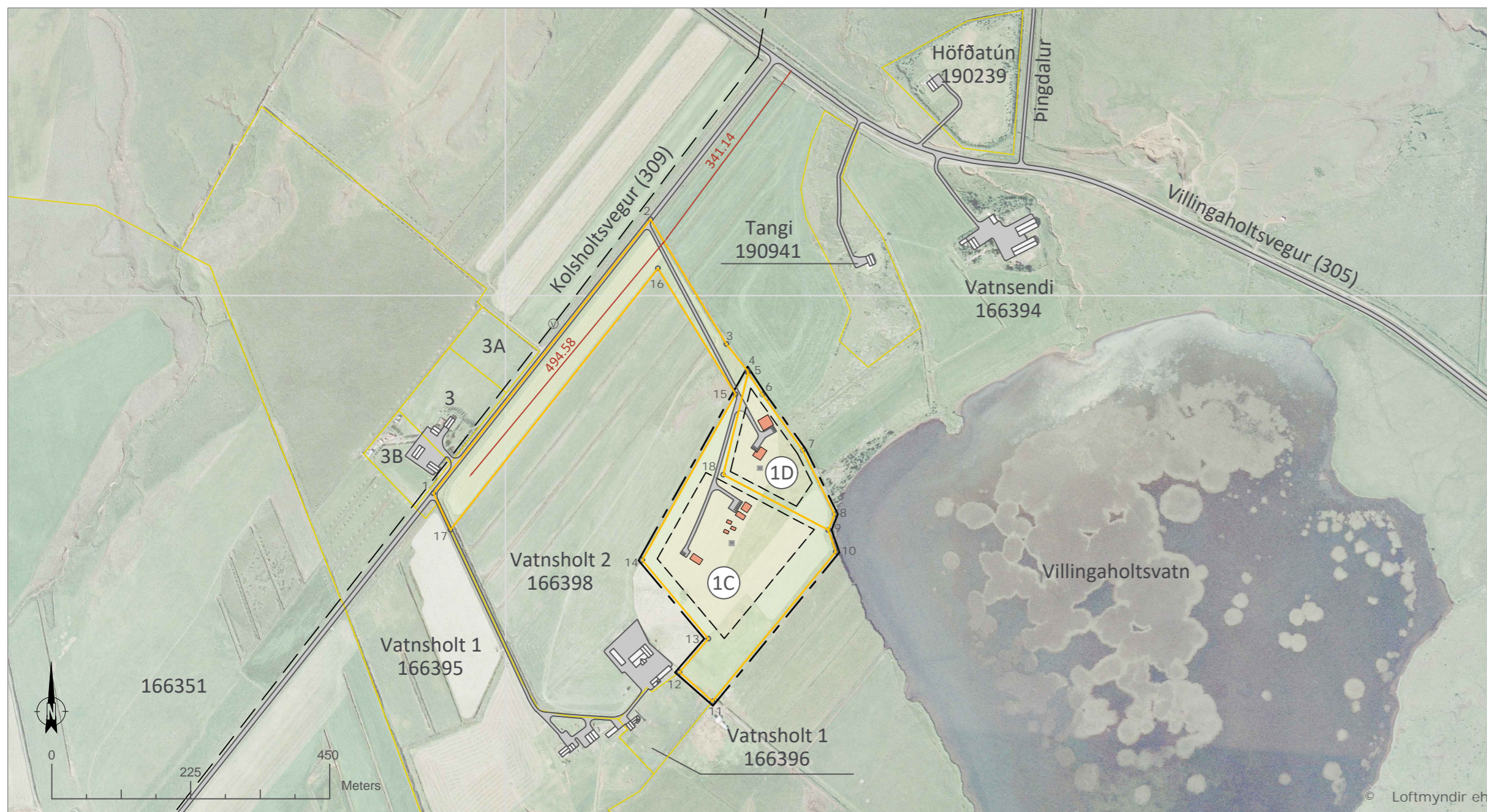
Skýringaruppdráttur í mkv. 1:7500

Deiliskipulag þetta, sem kynnt og auglýst hefur verið samkvæmt 40. og 41. gr. skipulagslaga nr. 123/2010, með síðari breytingum, var samþykkt af sveitarstjórn Flóahrepps þann _____