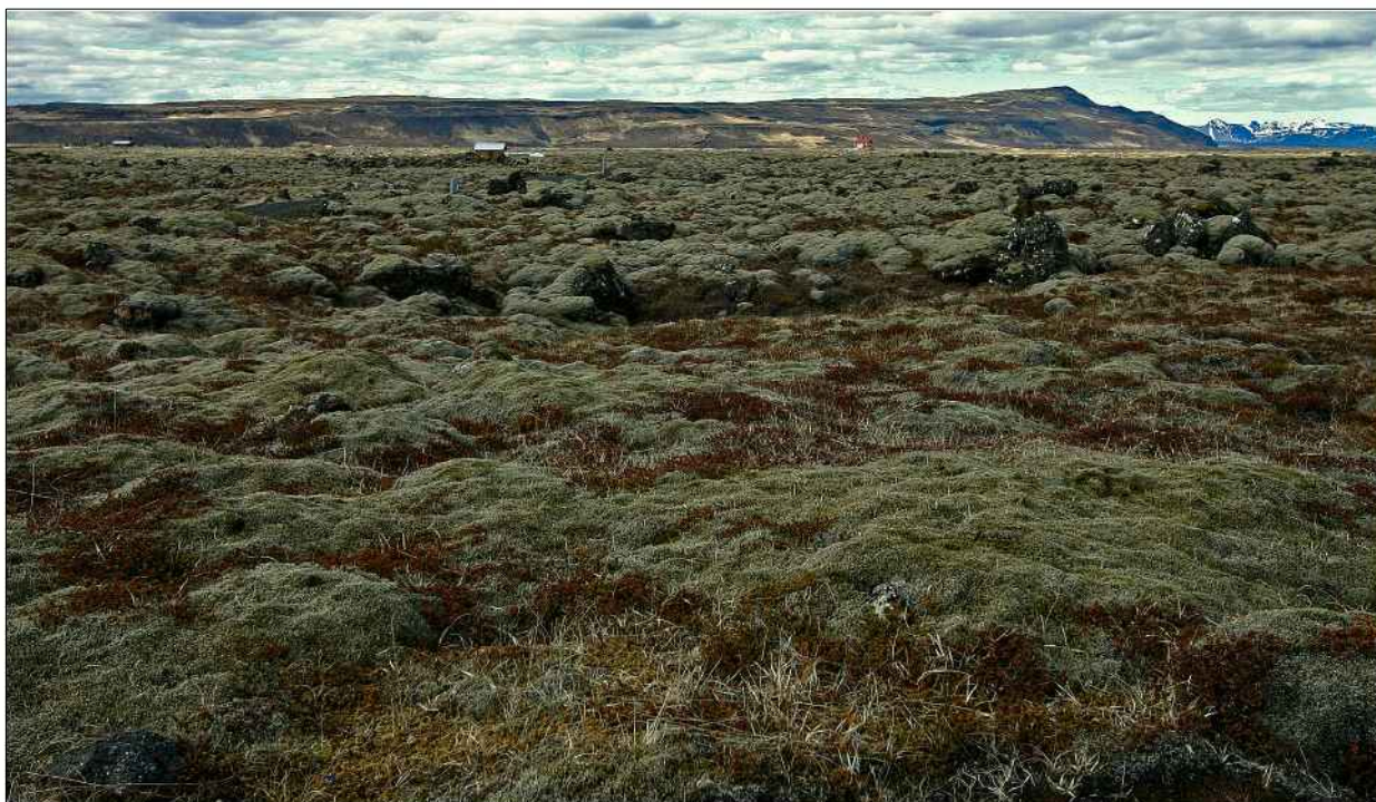
Mynd frá svæðinu, Hestfall í baksýn