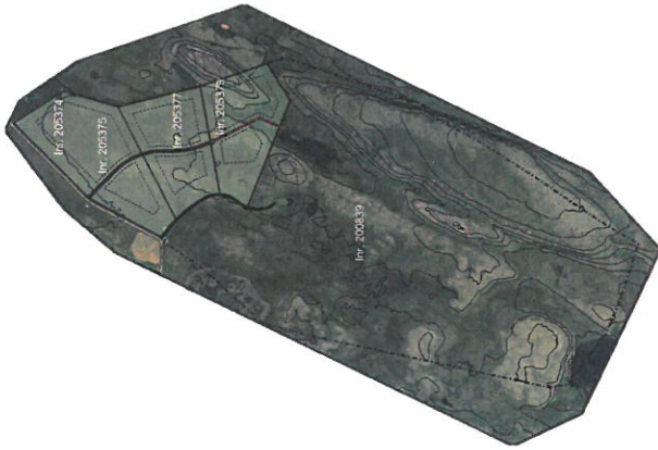
Yfirlitsmynd, Kjaransstaðir II, skýringamynd við deiliskipulag í mkr. 1:20.000