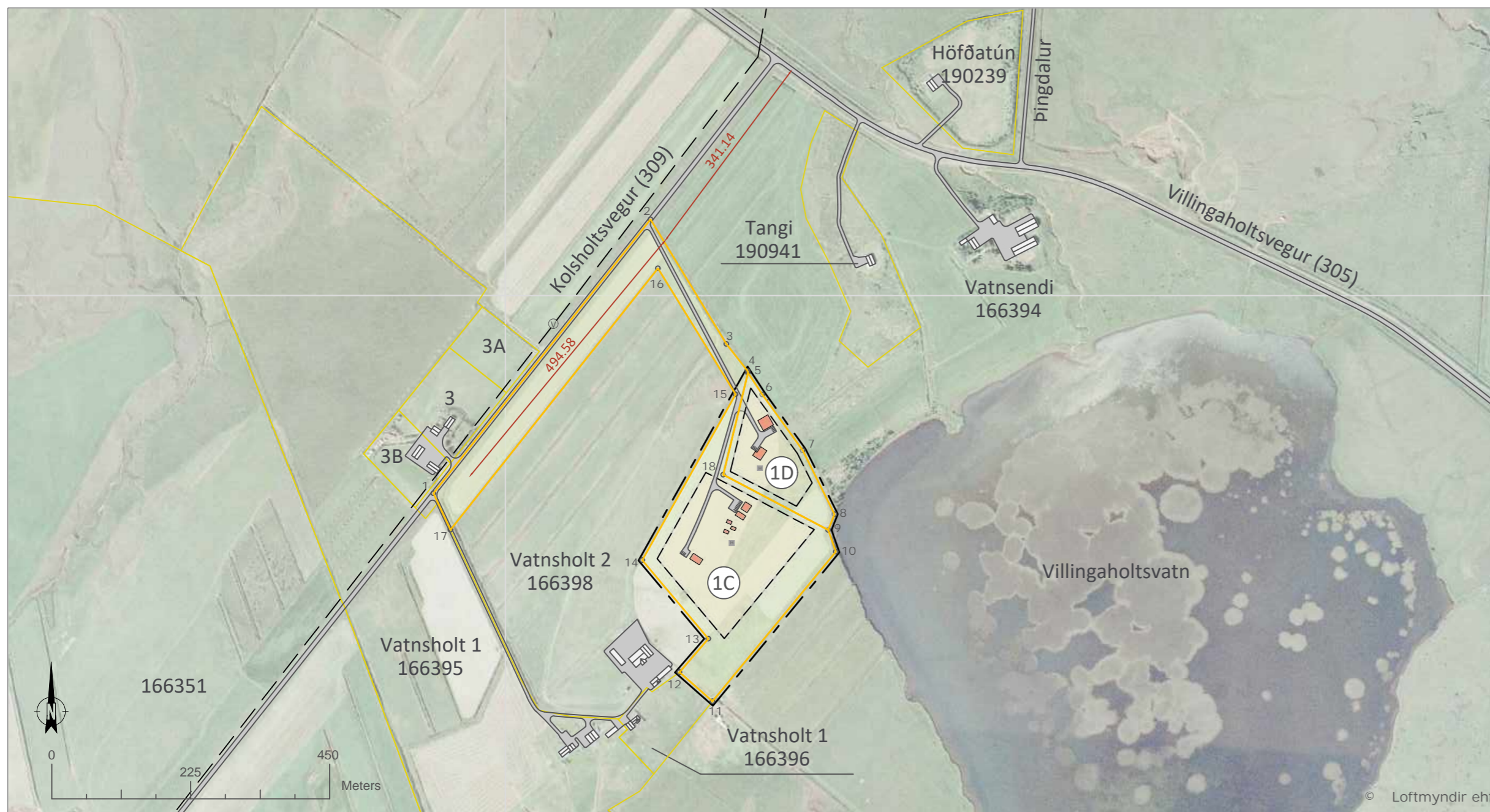
Skýringaruppdráttur í mkv. 1:7500

Deiliskipulag þetta, sem kynnt og auglýst hefur verið samkvæmt 40. og 41. gr. skipulagslaga nr. 123/2010, með síðari breytingum, var samþykkt af sveitarstjórn Flóahrepps þann _____