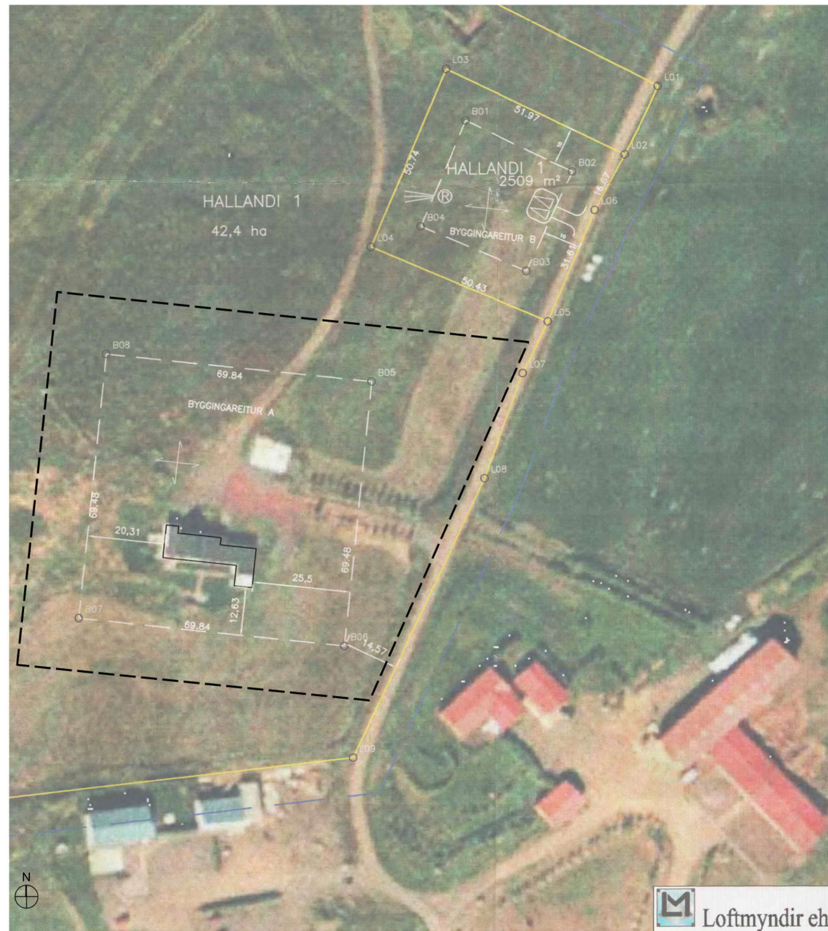
HLUTI GILDANDI DEILISKIPULAGS 1:1000, SAMP. 20.12.2006