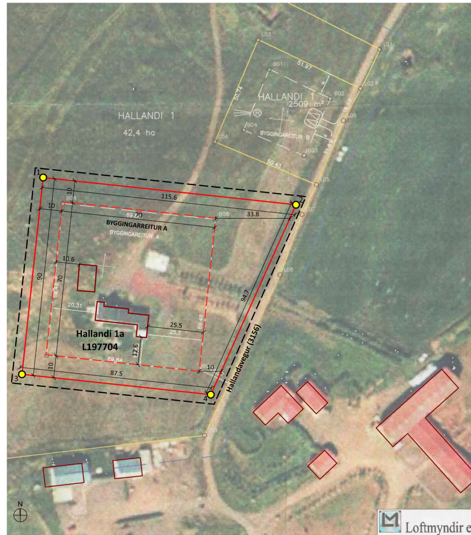
TILLAGA AÐ BREYTINGU Á DEILISKIPULAGI 1:1000

Að öðru leyti gilda skilmálar gildandi deiliskipulags, dags. 18.09.2006