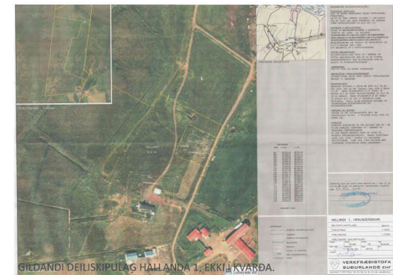
GILDANDI DEILISKIPULAG HALLANDA 1, EKKI Í KVARÐA.