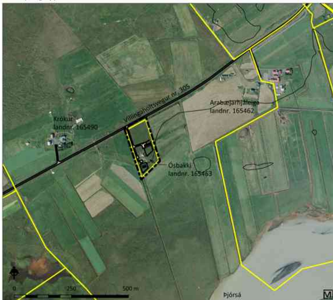
Skýringaruppdráttur í mkv. 1:10.000

Deiliskipulagstillagan var kynnt dags. _____