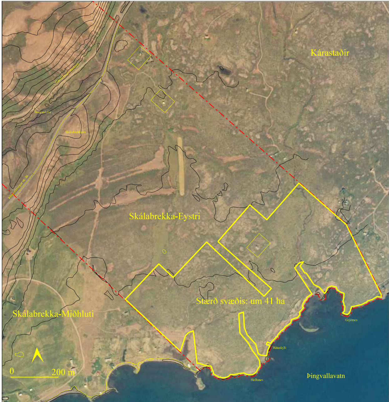
Fristundasvæðið eftir aðalskipulagsbreytingu er sýnt með gulri línu.