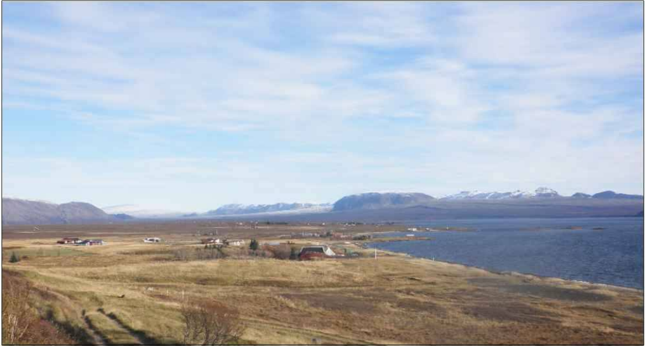
Séð frá vestri yfir frístundabyggðina í landi Skálabrekku