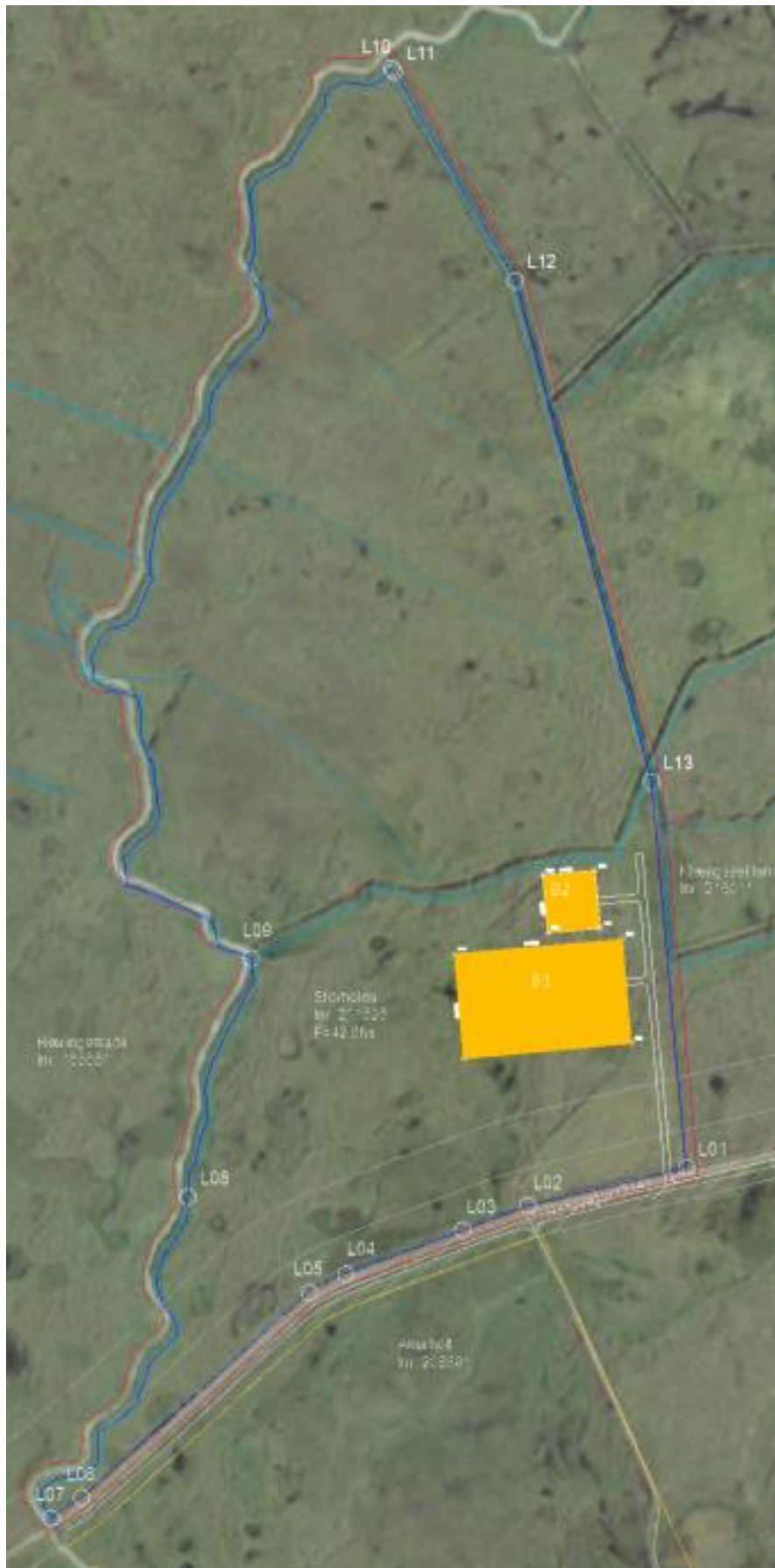
Mynd 1. Yfirlitsmynd af væntanlegu skipulagsvæði og nágrenni.