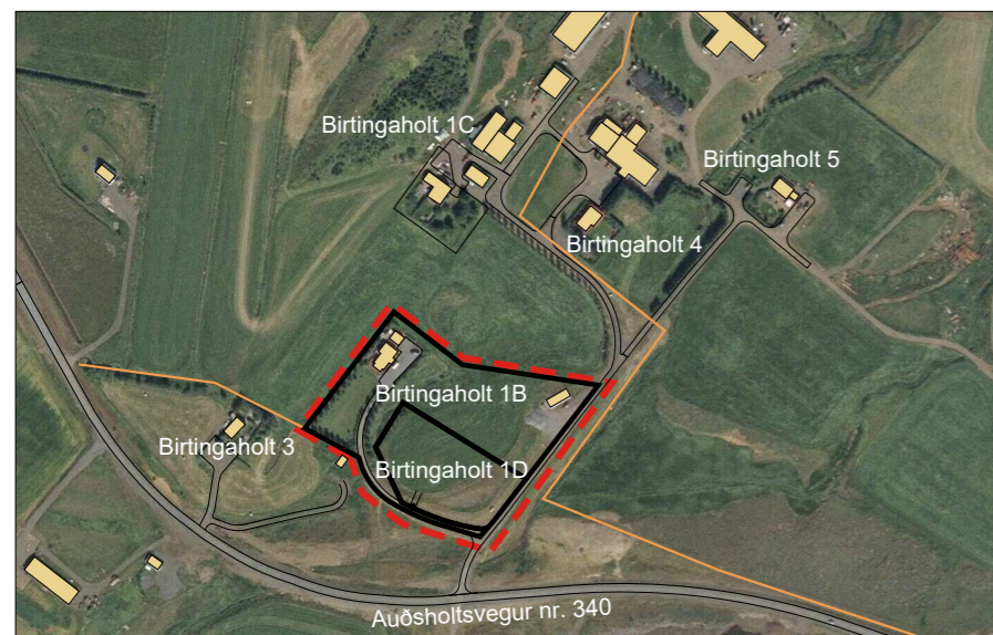
Yfirlitsmynd - ekki í kvarða