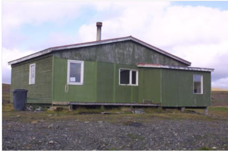
MYND 1. Skálinn í Leppistungum.

Leppistungur eru á bakka Kerlingar-ár sunnan undir Kerlingaröldu. Aðkoma er af vegslóða sem liggur um Hrunamannafrétt. Staðurinn er skráður í þjóðskrá, landnr. 166846. Í Leppistungum er 70 m 2 hús sem byggt var árið 1987. Einnig gamalt leitarannahús (torfkofi). Þessi hús eru notuð sem leitarannahús og fyrir ferðamenn á sumrin, einkum hestahópa. Einnig er 36 m 2 hesthús og hestagerði við það. Gisting er fyrir um 24 gesti. Salerni er í sér húsi og rotþró tengd því. Vatn er tekið úr læk skammt norðaustan svæðisins. Starfsemi er aðallega yfir sumartímenn. Mannvirki eru í eigu Hrunamannahrepps. Staðurinn er í um 500 m h.y.s.