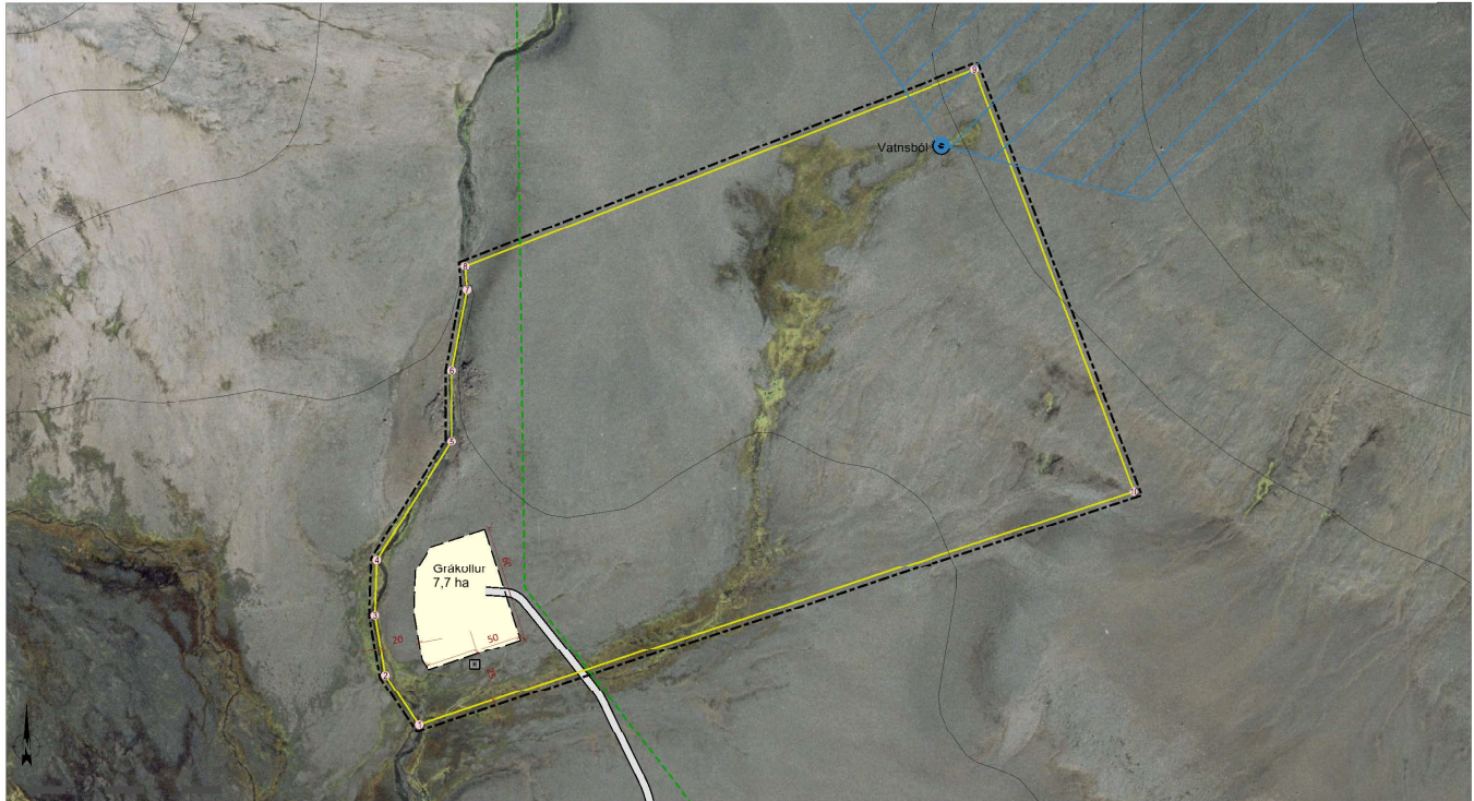
Deiliskipulagsuppráttur í mkv. 1:2.000.