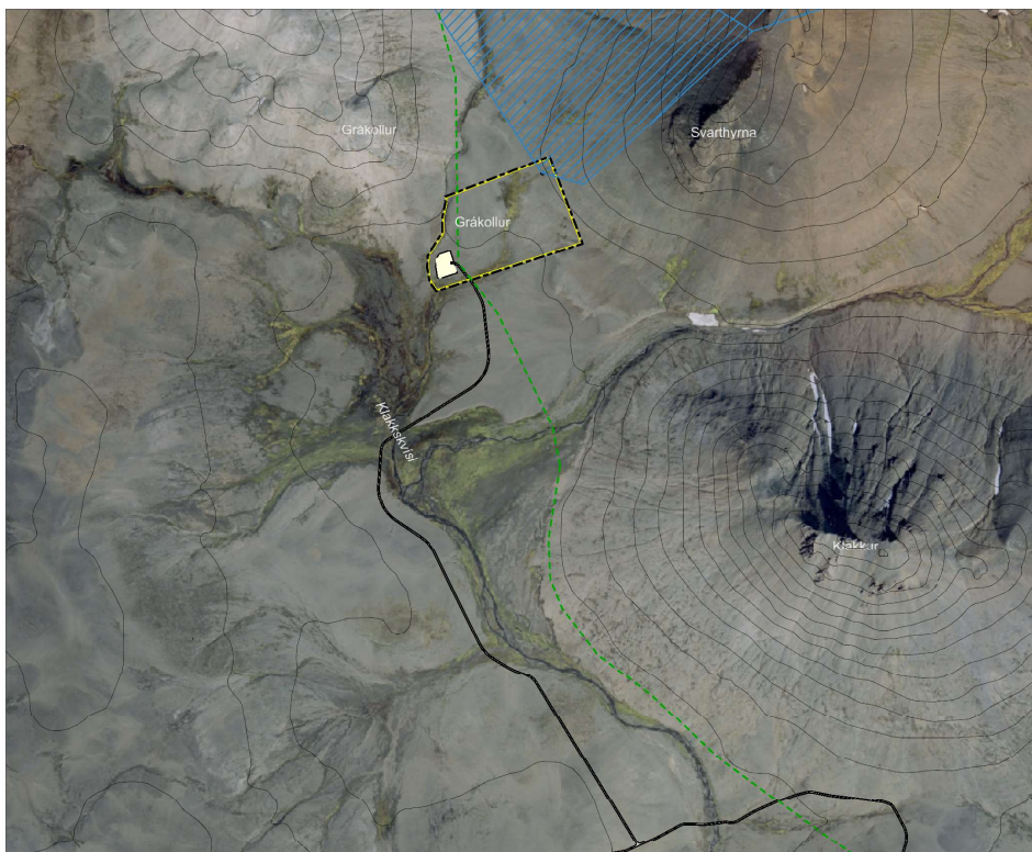
Skýringaruppráttur í mkv. 1:10.000.

Skipulagslýsing var auglýst frá 24.07.2019 til 14.08.2019. Deiliskipulagstillagan var kynnt frá 18.12.2019 til 08.01.2020. Deiliskipulagstillagan var auglýst frá _____ til _____