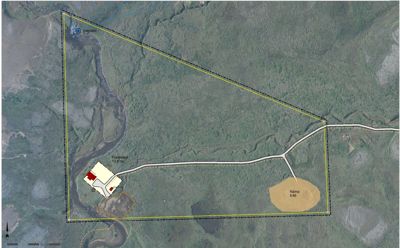
Deiliskipulagsuppráttur í mkv. 1:2.000.