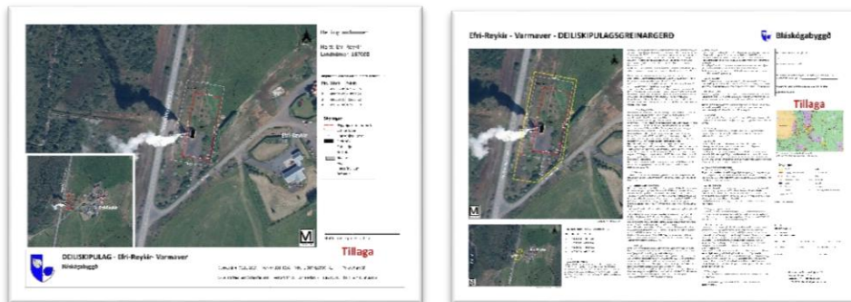
Mynd 3 Skjámynd af fylgigögnum.

Með greinargerð þessari fylgir deiliskipulagsuppráttur og yfirlitsskjal deiliskipulagsgreinargerðar dagsett: 05.11.2019.