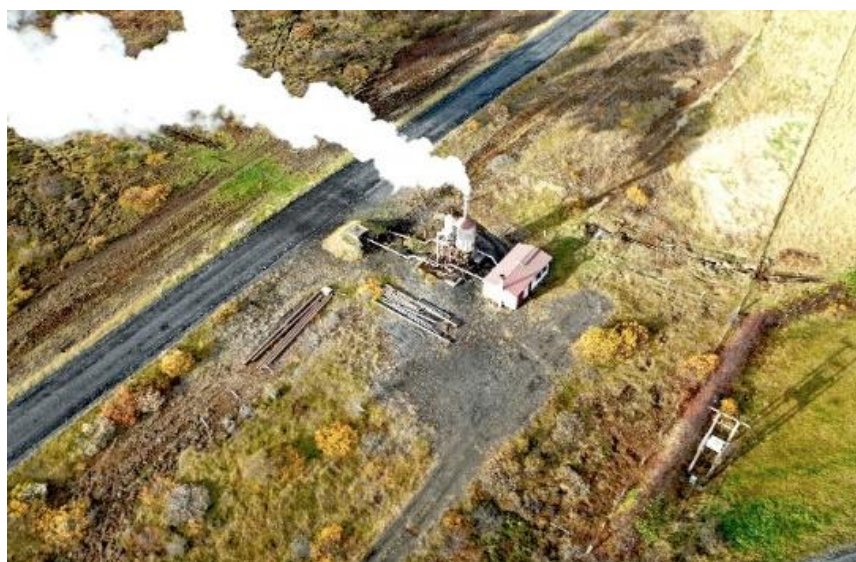
Mynd 1. Yfirlitsmynd, Efri-Reykir borhola (ER23).

Berglind Ragnarsdóttir. Skipulagsfræðingur/ráðgjafi berglind@svinnur.com