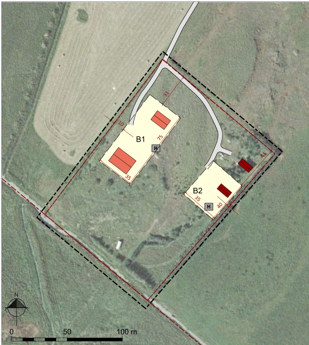
Deiliskipulagsuppráttur í mkv 1:2.000.