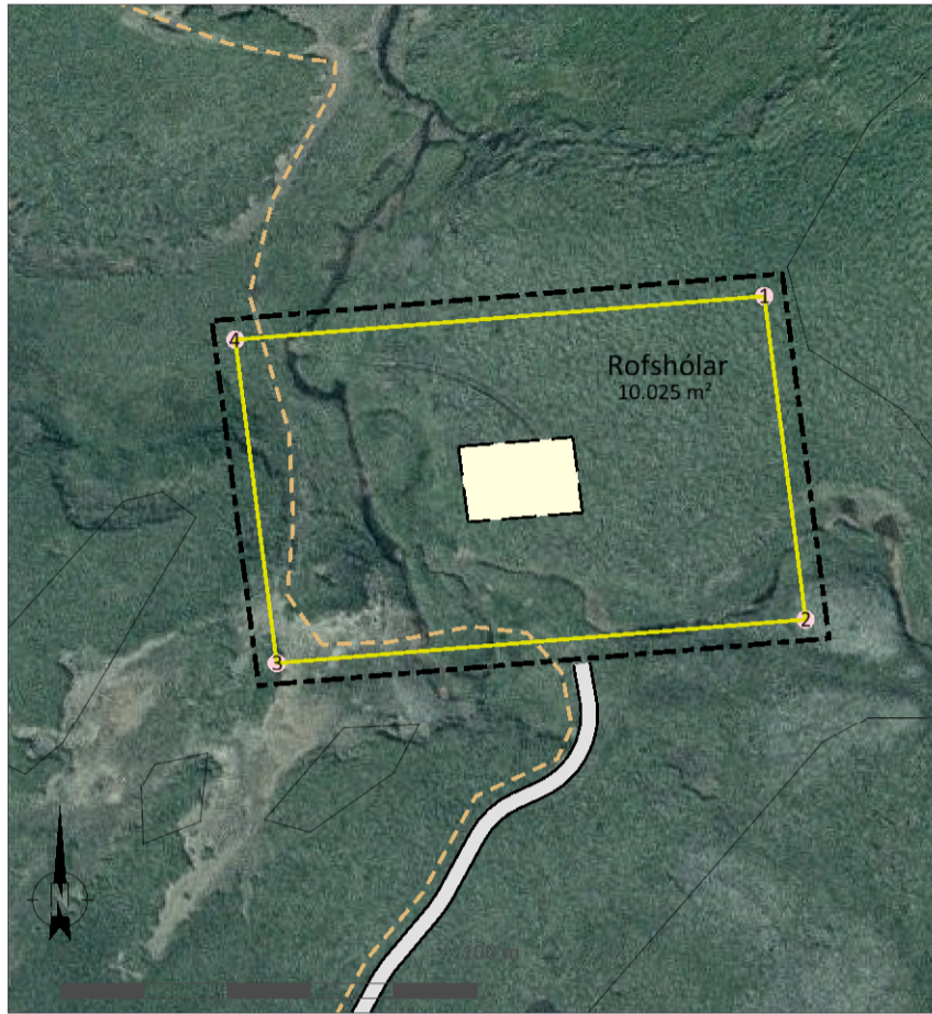
Deiliskipulagsuppráttur í mkv. 1:2.000.