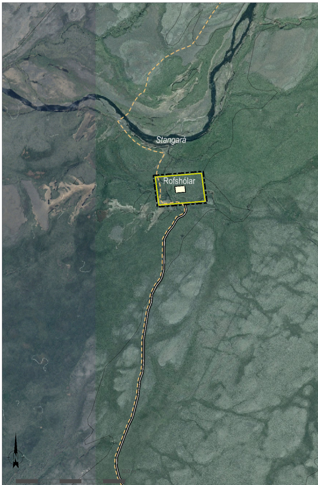
Skýringaruppráttur í mkv. 1:6.000.