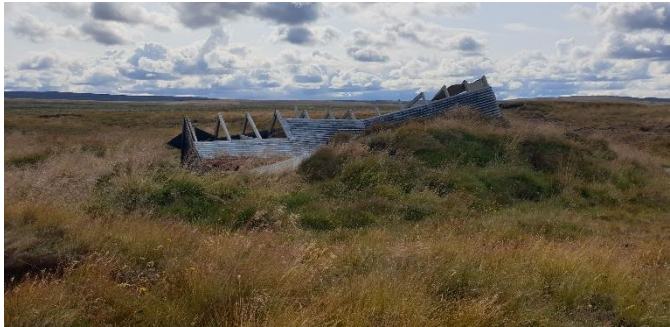
Mynd 1. Rofshólar.

Rofshólar eru skammt frá Stangará. Þar er gamall torfkofi sem upphaflega var notaður sem leitarmannahús. Í dag er staðurinn notaður sem áningarstaður fyrir ferðamenn, einkum á reiðleið um Hrunamannafrétt. Engin gisting er á staðnum. Illfær slóði er að staðnum. Engin salernisaðstaða og vatn er tekið úr læk skammt frá. Mannvirki eru í eigu Hrunamannahrepps. Staðurinn er í um 260 m h.y.s.