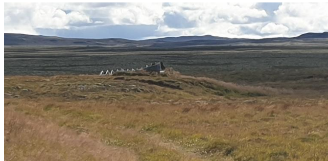
Mynd 2. Horft yfir skálann og næsta nágrenni hans.

Svæðið er gróið að hluta til og skv. vistgerðarkortlagningu Náttúrufræðistofnunar eru þar vistlendingin mólendi, moslendi, melar og sandlendi. Vistgerðir eru lyngmóavist á hálendi, hraungambravist, melagambravist og eyðimelavist.