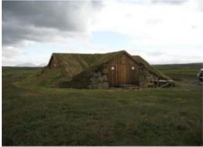
Mynd 1. Skálinn í Fosslæg.

Svæðið er gróið og skv. vistgerðarkortlag- ningu Náttúrufræðistofnunar eru þar vist- lendin mólendi og graslendi og vistgerðirn- ar fjalldrapamóavist, víðikjarrvist, star- ungsmýrarvist, víðimóavist og grasengja- vist.