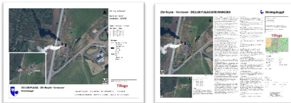
Mynd 3 Skjámynd af fylgigögnum.

Með greinargerð þessari fylgir deiliskipulagsuppdráttur og yfirlitsskjal deiliskipulagsgreinargerðar dagsett: 05.11.2019.