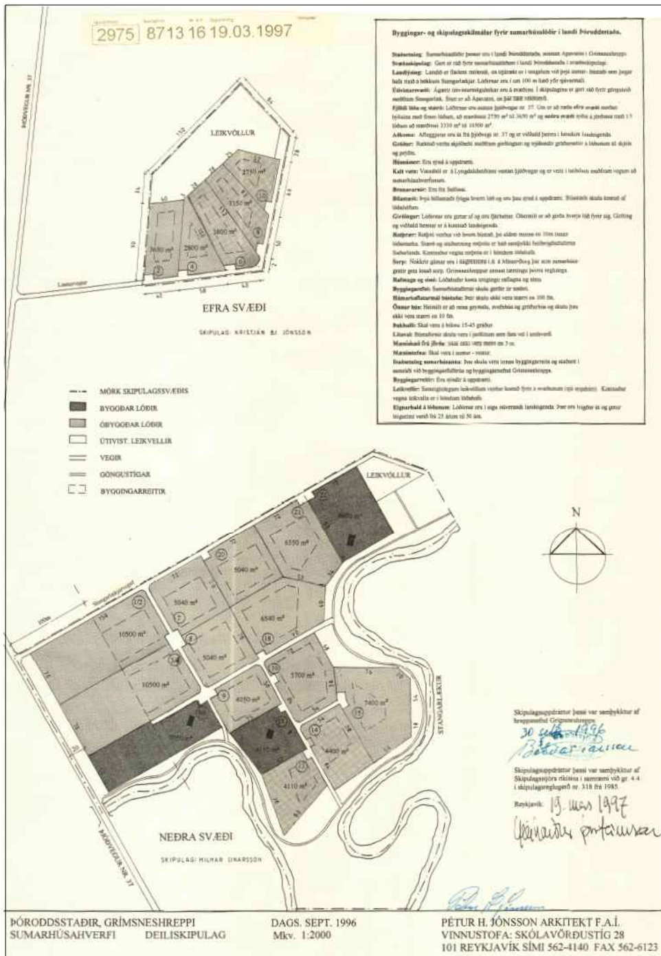
Núverandi deiliskipulag, samþykkt af Skipulagsstjóra ríkisins 18. mars 1997

Á svæðinu er í gildi deiliskipulag sem var samþykkt af Skipulagsstjóra ríkisins í samræmi við gr. 4.4. í skipulagsreglugerð nr. 318 frá 1985 þann, 18. mars 1997. Skilmálabreytingar hafa verið gerðar á deiliskipulaginu, samþykktar í sveitarstjórn Grímsnes og Grafningshrepps skv. 1. mgr. skipulagslaga nr. 123/2010, þann 3. febrúar 2016 og skv. 2. mgr. 43. gr. skipulagslaga nr. 123/2010, þann 12. desember 2016.