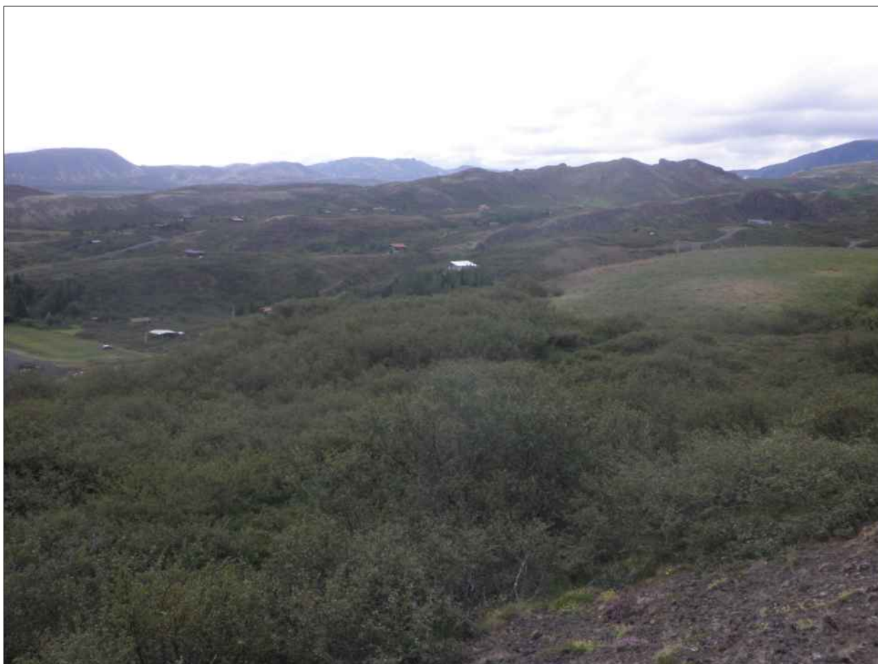
Séð yfir frístundabyggðina í landi Nesja

Á deiliskipulagssvæðinu eru 38 frístundalóðir og eru þær allar byggðar nema ein. Innan svæðisins eru göturnar Tjarnalaut og við hana eru 19 lóðir og Réttarháls og við hana eru 16 lóðir. Þrjár lóðir eru við veginn sem liggur að Hestvík og þær heita Litla Hestvík 1 og 2 og Kleifarkot. Við Hestvík eru tvö bátaskýli og er annað þeirra á skilgreindri lóð.