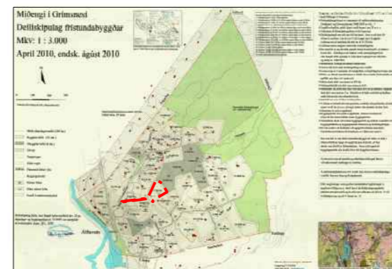
Samþykkt deiliskipulag, samþykkt 5.11.2010

Breytingin felst í að lóðin Vaðlækjarvegur 8, landnr: 169070, stækkar úr 7.800 fm í 8.352 fm. Byggingareitur er óbreyttur. Að öðru leyti gilda áfram deiliskipulagsskilmálar í samþykktu deiliskipulagi.