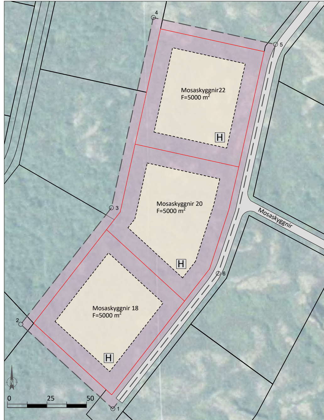
Gildandi deiliskipulag mkv.1:1500