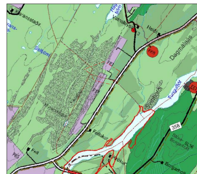
Hluti aðalskipulags Bláskógabyggðar 2015-2027 Aðalskipulagsbreyting í ferli