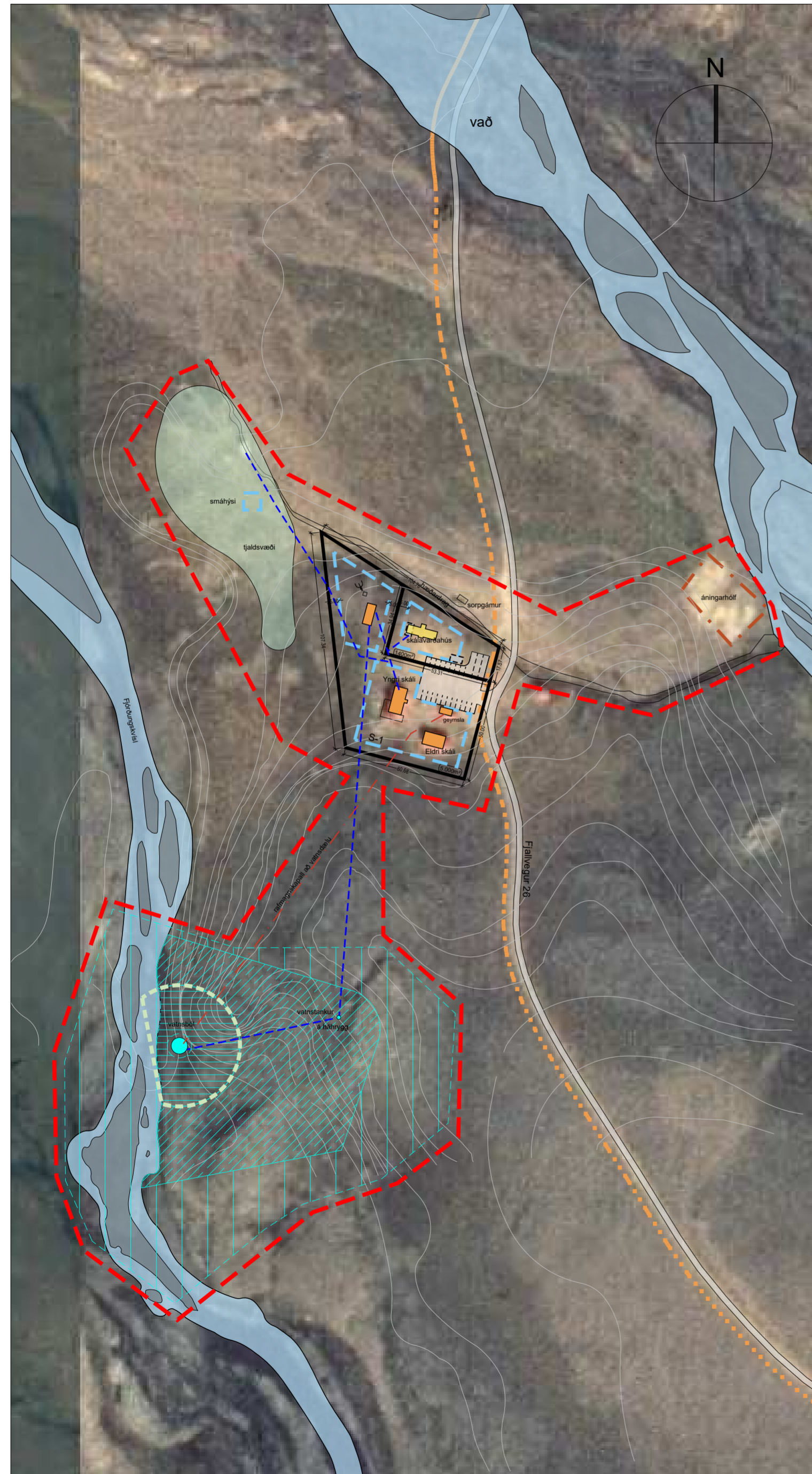
Yfirlitsuppráttur, mkv. 1:2.000