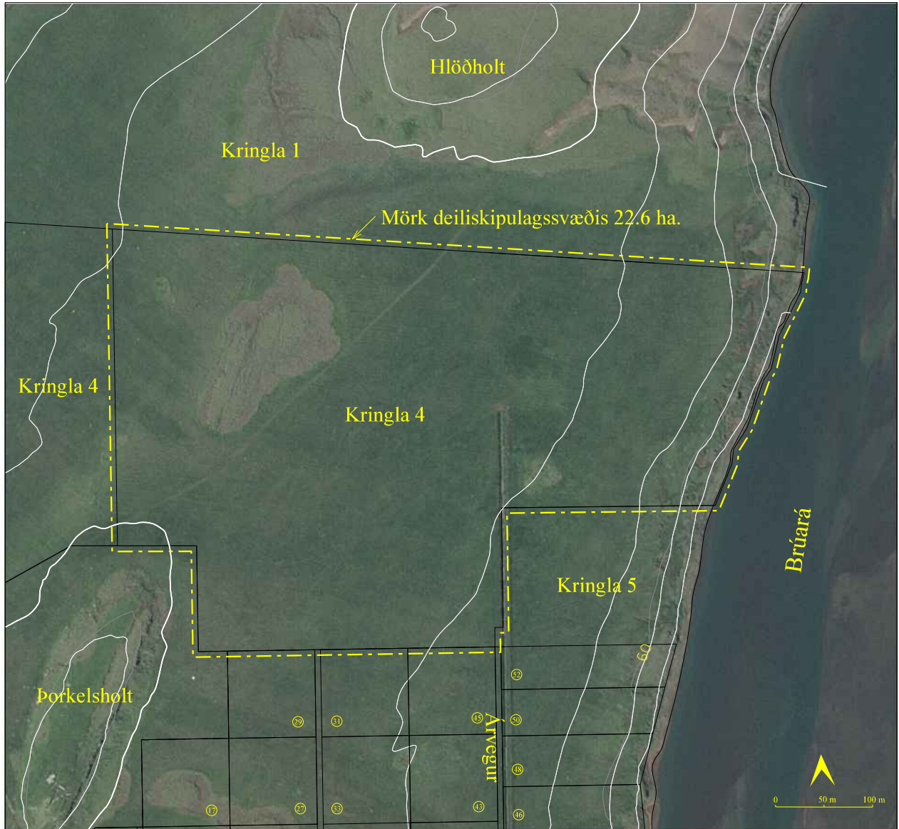
Skipulagssvæðið er sýnt með gulri línu.