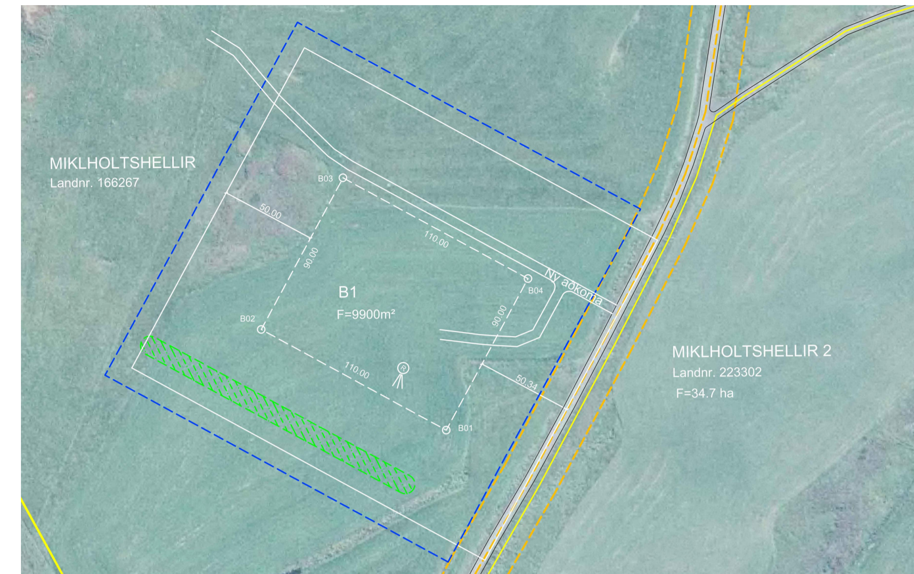
Skipulag nr.13832 - Fellur úr gildi við gildistöku nýs skipulags.