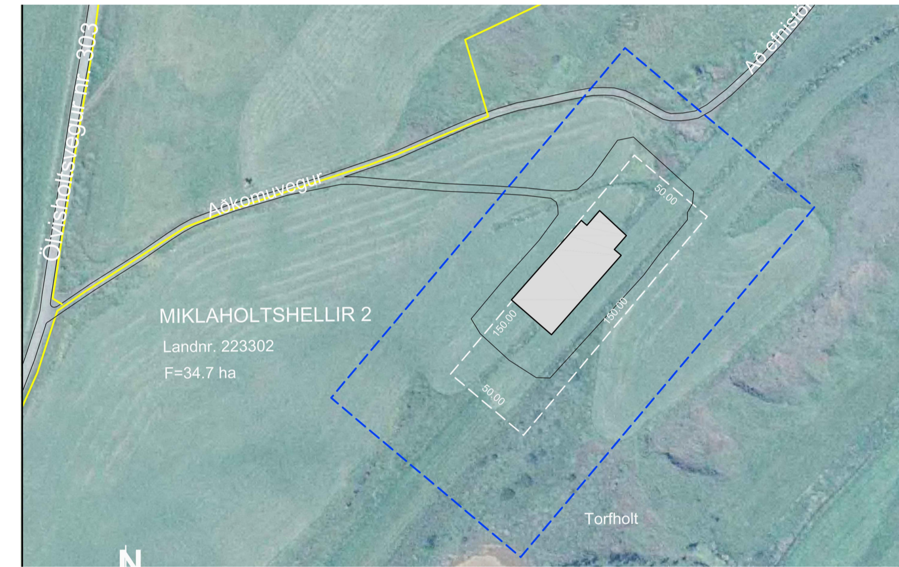
Skipulag nr.12047 - Fellur úr gildi við gildistöku nýs skipulags.