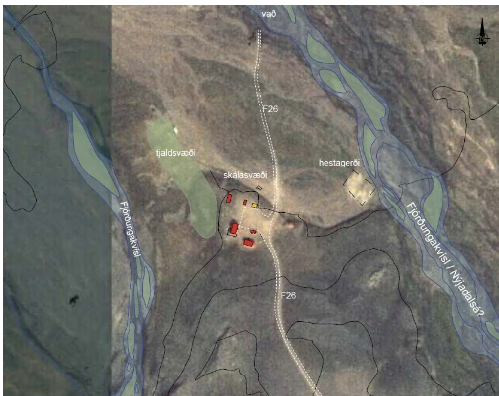
Yfirlitsloftmynd er sýnir skálavæðið við Nýjadal

Skipulagið gerir ráð fyrir að öll mannvirki skuli tengjast almennri ferðaþjónustu og er þeim ætlað að veita ferðafólki öryggi og þjónustu sem eðlileg getur talist á svæði sem þessu. Ekki er heimilt að reisa byggingar innan svæðisins til einkanota heldur skulu þær þjóna breiðum hópi ferðamanna. Uppbygging skal vera í sem mestri sátt við umhverfið og taka mið af því að um mannvirki í óbyggðum er að ræða. Að svo miklu leyti sem það er hægt skulu framkvæmdir og mannvirki vera afturkræf.