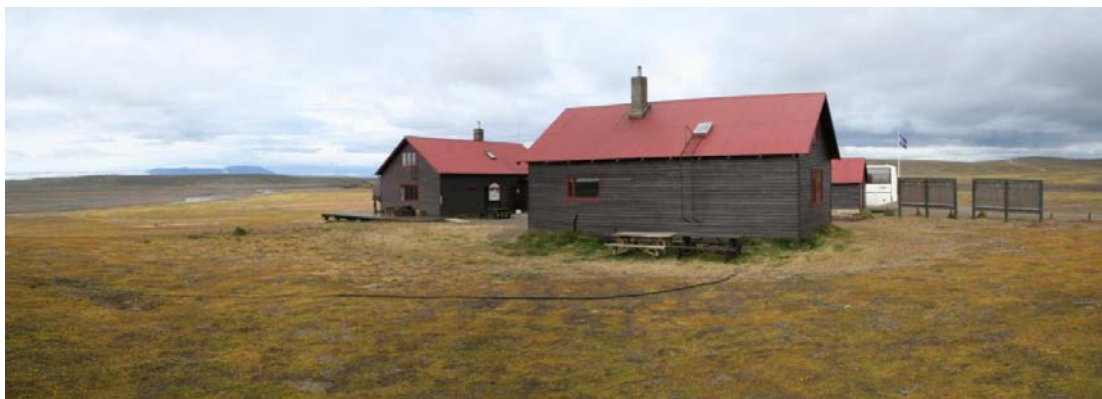
Skálarnir í Nýjadal

Lýsing þessi er unnin skv. 1. mgr. 40. gr. skipulagslaga nr. 123/2010, m.s.br. Fyrirhugað er að leggja fram tillögu að deiliskipulagi fyrir skálasvæðið í Nýjadal inná Sprengisandsleið. Samkvæmt aðalskipulagi Ásahrepps 2010-2022, er það skilgreint sem verslunar- og þjónustusvæði, fyrir skála. Ennfremur er lögð fram matslýsing sem kynnt er samhliða skipulagslýsingunni. Vinna við deiliskipulagsgerð svæðisins fór af stað á vegum Vatnajökulsþjóðgarðs í samvinnu við Ferðafélag Íslands árið 2010 en var aldrei lokið. Síðan þá hefur verið sótt um stöðuleyfi fyrir hús hálandisgæslunnar innan svæðisins. Til stendur að endurnýja aðstöðu fyrir skálaverði, landverði og starfsfólk hálandisgæslunnar í sameiginlegu húsi fyrir allt starfsfólk.