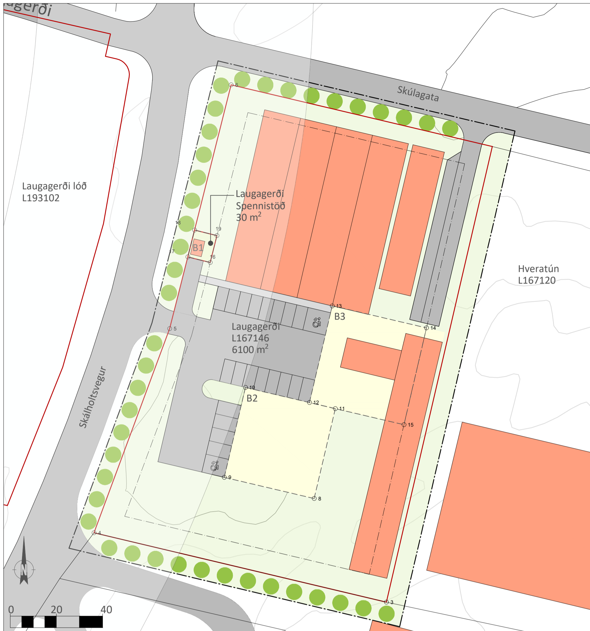
Deiliskipulagsuppráttur eftir breytingu - mkv. 1:500