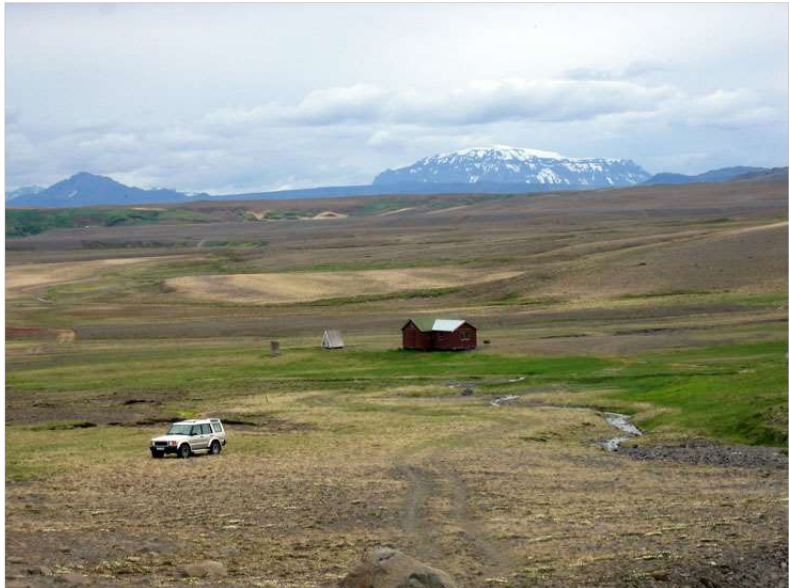
MYND 1. Fjallaskálinn í Fremstaveri ásamt salernishúsi.

„Sveitarfélög á miðhálandinu útfæri landsskipulagsstefnu um verndun víðerna- og náttúrugæða í skipulagsáætlunum sínum. Við skipulagsgerð sveitarfélaga verði þess gætt að mannvirki og umferð um hálandið skerði víðerni og önnur sérkenni og náttúrugæði hálandisins sem minnst. Jafnframt verði kannaðir möguleikar á endurheimt víðerna og náttúrugæða. Til grundvallar stefnumörkun verði lögð kortlagning á umfangi víðerna, vistgerðakort Náttúrufræðistofnunar Íslands og svæði sem njóta verndar vegna náttúruvafars. Á svæðum sem flokkast sem víðerni verði svigrúm fyrir takmarkaða mannvirkjagerð, svo sem gönguskála, vegslóða og göngu- og reiðleiðir. Umfangsmeiri mannvirkjagerð