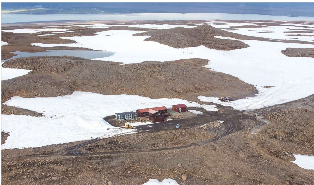
MYND 1. Fjallaskálinn í Skálpanesi, horft til norðausturs.

Skálpanes er við Langjökul, nokkuð vestan Geldingafells. Staðurinn nýtir sömu aðkomu og Geldingafell. Á staðnum eru tvö hús, um 150 m 2 hús sem nýtt er sem aðstaða fyrir ferðamenn sem fara í ferðir á Langjökul, einnig er þarna um 20 m 2 hús fyrir starfsfólk. Ferðaþjónusta er rekin á staðnum allt árið. Svæðið er lítt gróið og vistgerðir á svæðinu eru melar- og sandlendi, skv. vistgerðarkortlagningu Náttúrufræðistofnunar. Skálpanes er í um 800 m.h.y.s.