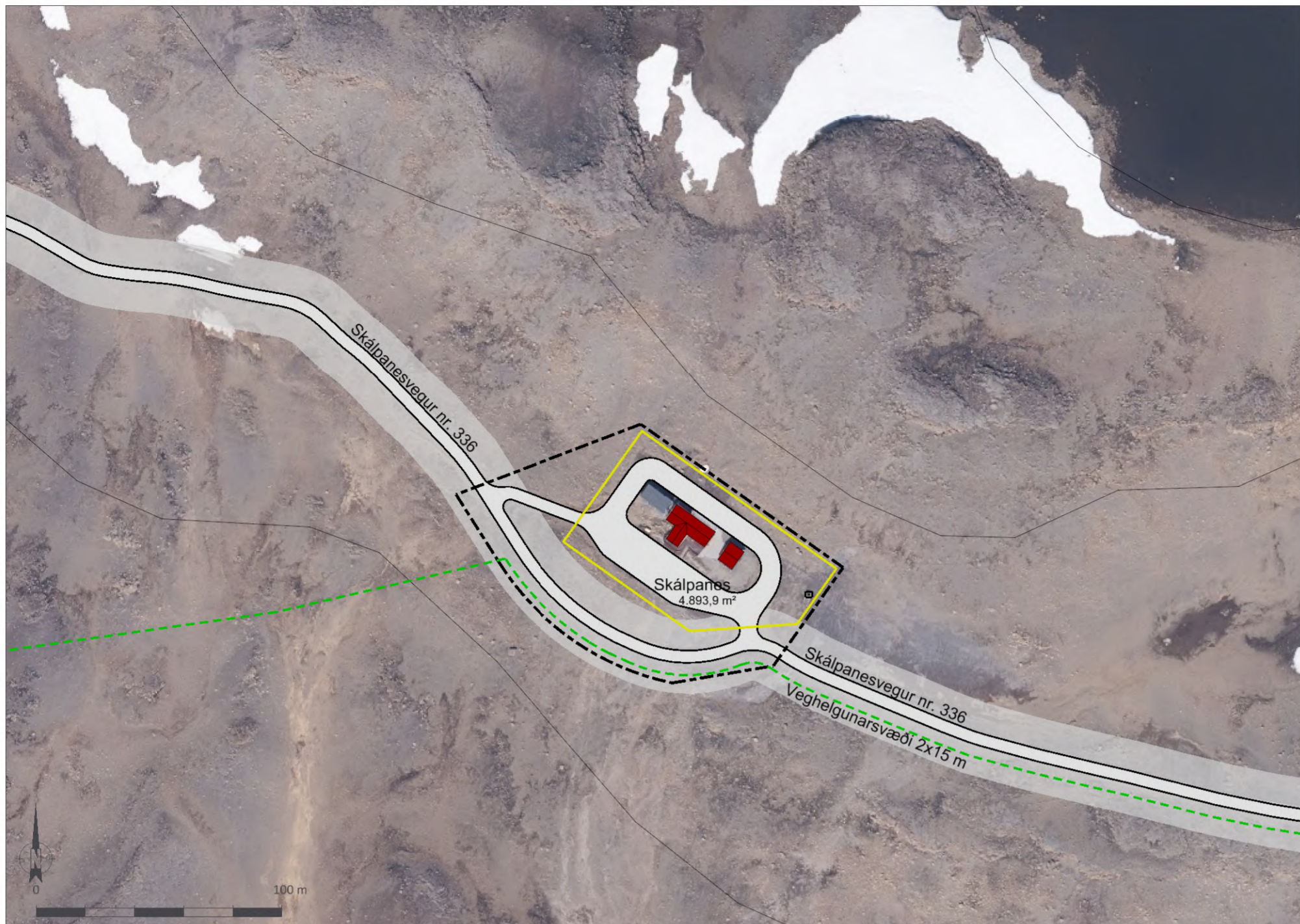
Deiliskipulagsuppráttur í mkv. 1:2.000.