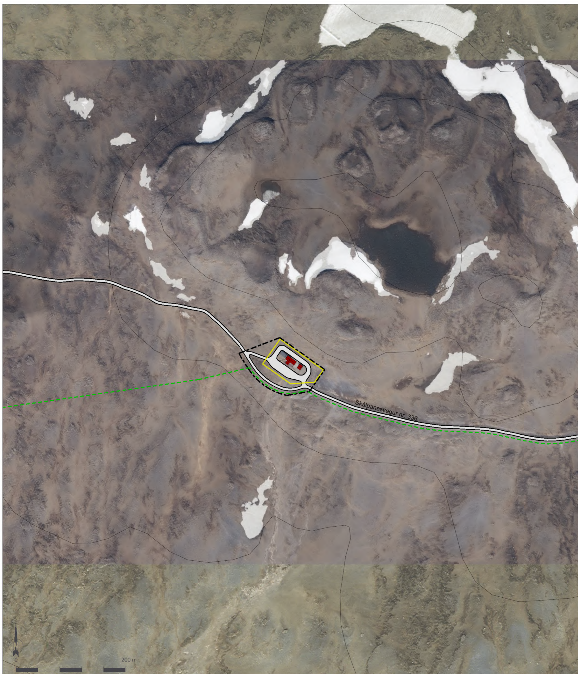
Skýringaruppráttur í mkv. 1:4.000.