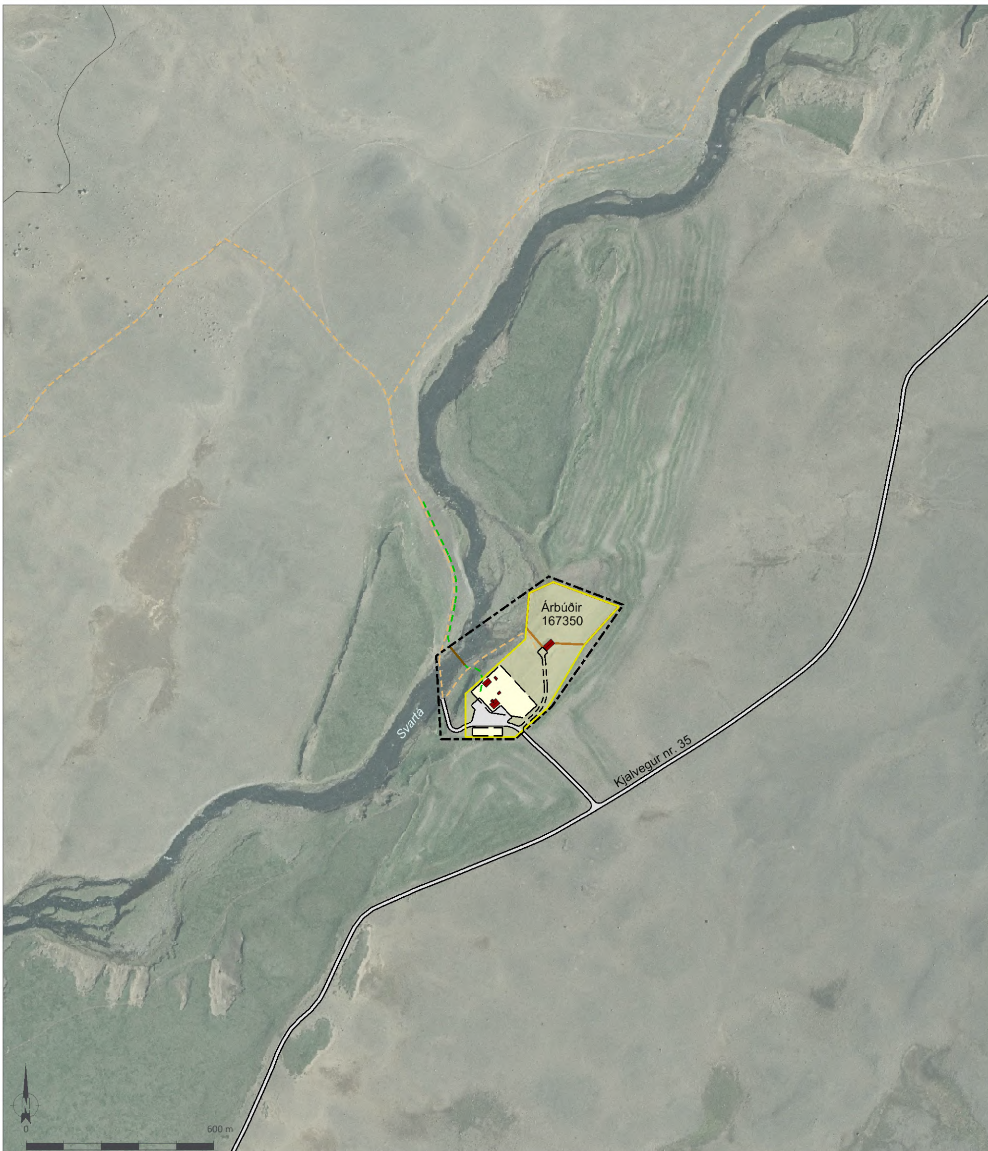
Skýringaruppráttur í mkv. 1:5.000.