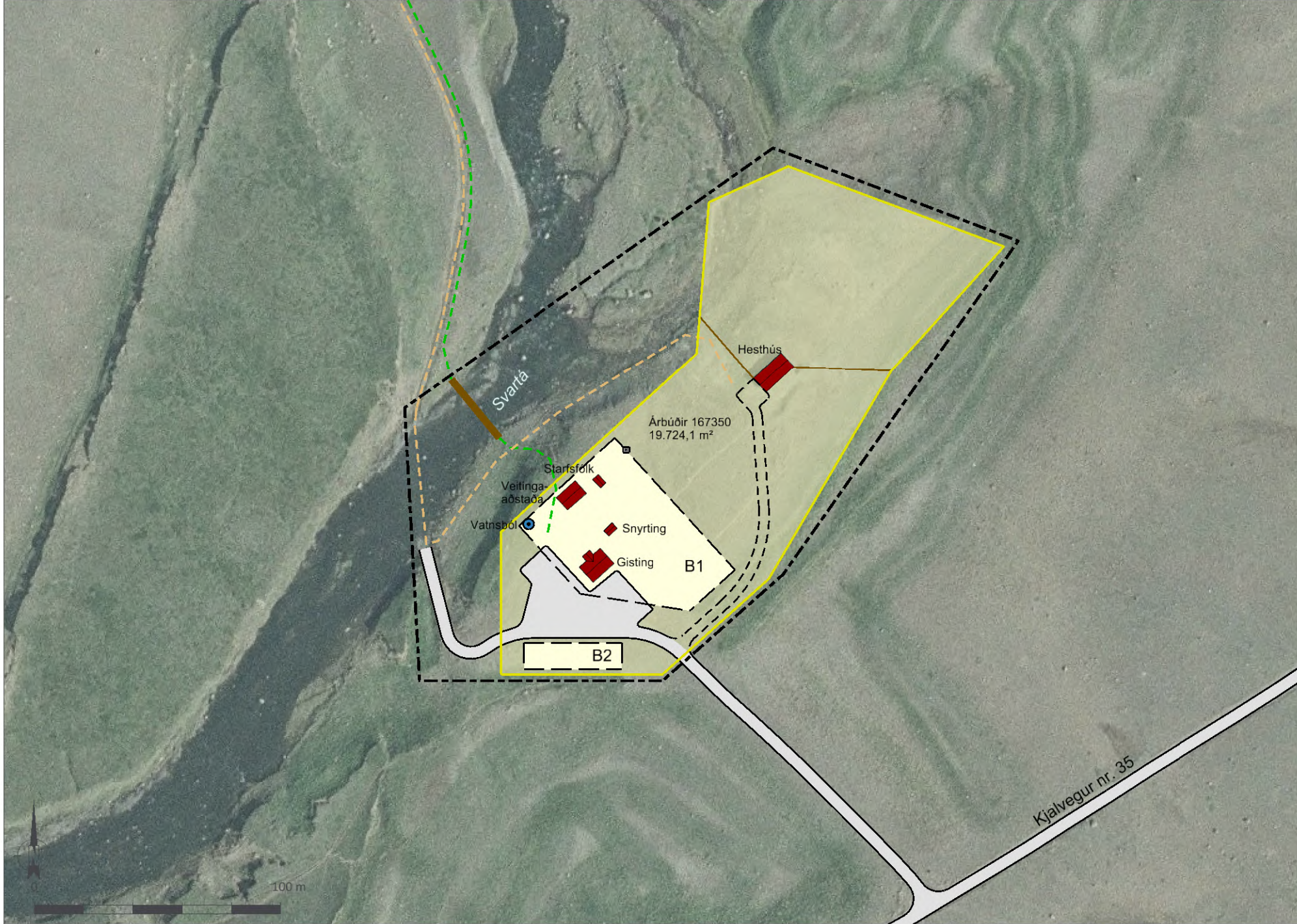
Deiliskipulagsuppráttur í mkv. 1:2.000.