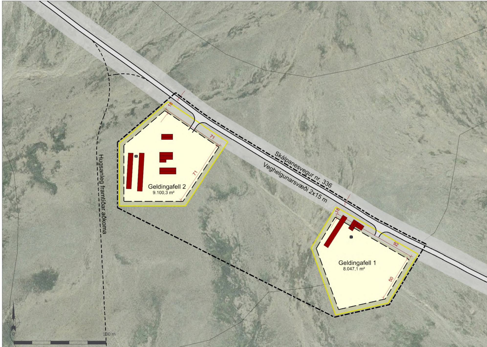
Deiliskipulagsuppráttur í mkv. 1:2.000.