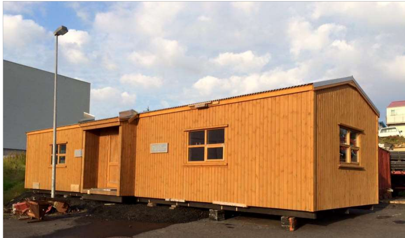
MYND 1. Nýja húsið sem verður flutt í Súlnadal.

Bratti er í Súlnadal í Botnssúlum, norðvestan við Syðstu Súlu. Á staðnum var um 22 m 2 hús, sem var nær eingöngu nýtt af Íslenska alpaklúbbnum. Húsið var orðið ónýtt og hefur verið fjarlæggt. Ekki er vegur að staðnum. Svæðið er lítt gróið. Vistgerðir á svæðinu eru skv. vistgerðarkortlagningu Náttúrufræðistofnunar, melar og sandlendi, skriður og klettur. Hvorki er vatnsból, rotþró né salernisaðstaða á svæðinu. Starfsemi er helst í tengslum við gönguferðir og ísklifur í Botnssúlum. Bratti er í um 770 m.h.y.s.