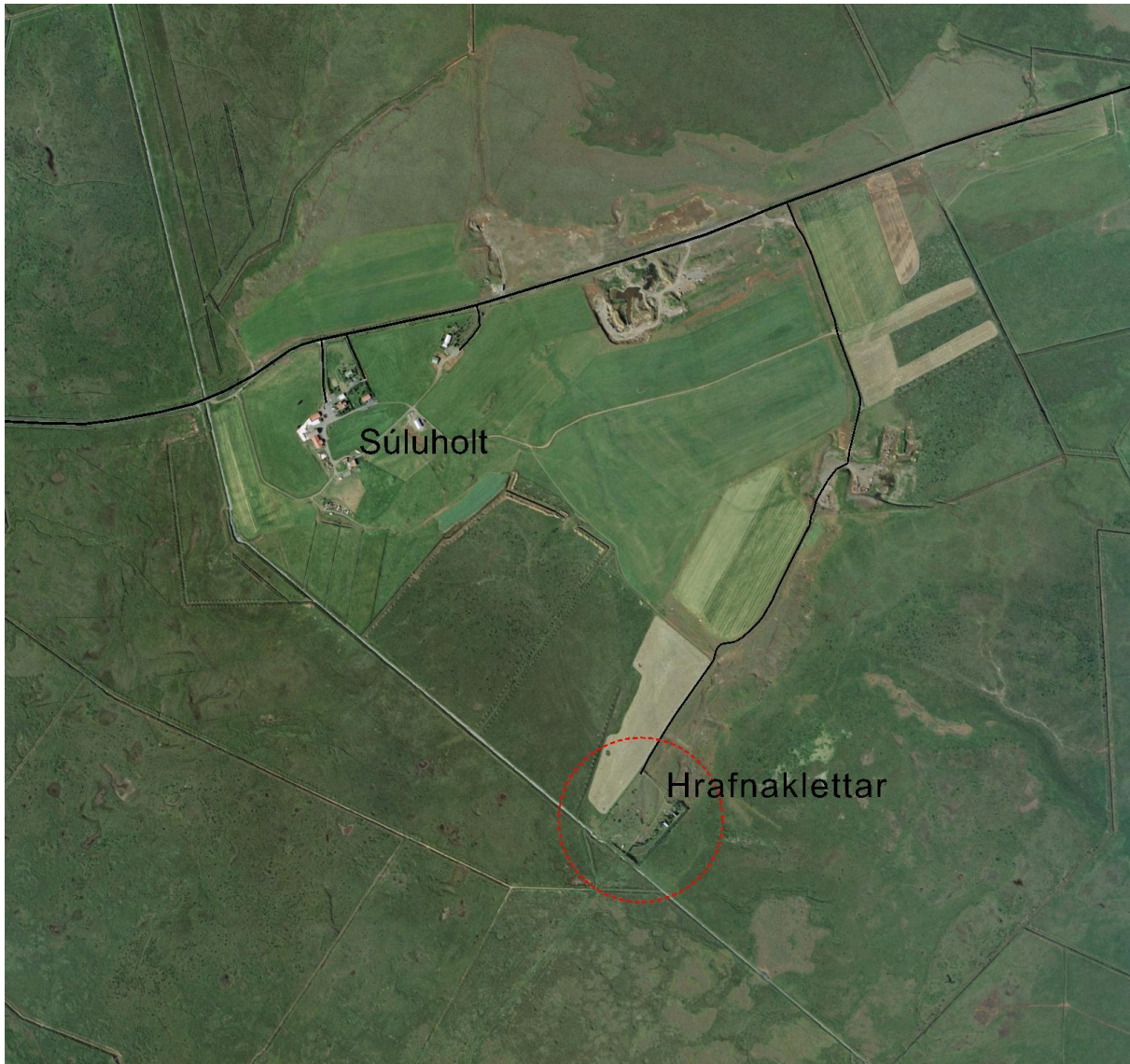
Mynd 3. Staðsetning deiliskipulagssvæðis, merkt með rauðum hring.

inn á lóðina. Hreinsivirki verða innan lóðar og verða sameiginleg eftir því sem við verður komið. Aðkoma að svæðinu verður óbreytt frá því sem nú er.