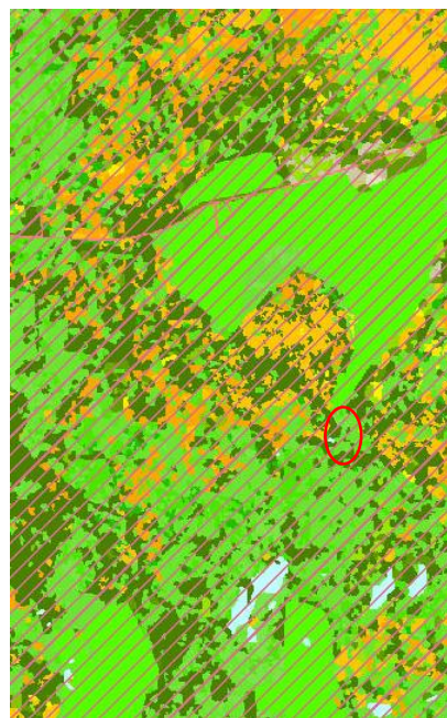
MYND 1. Vistgerðakort NÍ – rauður hringur markar skipulagssvæðið.

Fram kemur á kortasjá NÍ, Náttúrufræðistofnunar (apr. 2019) að Suðurland sé mikilvægt fuglasvæði þar sem víða sé að finna mikilvæg varpsvæði, sérstaklega fyrir himbrima, áfltt og skúm.