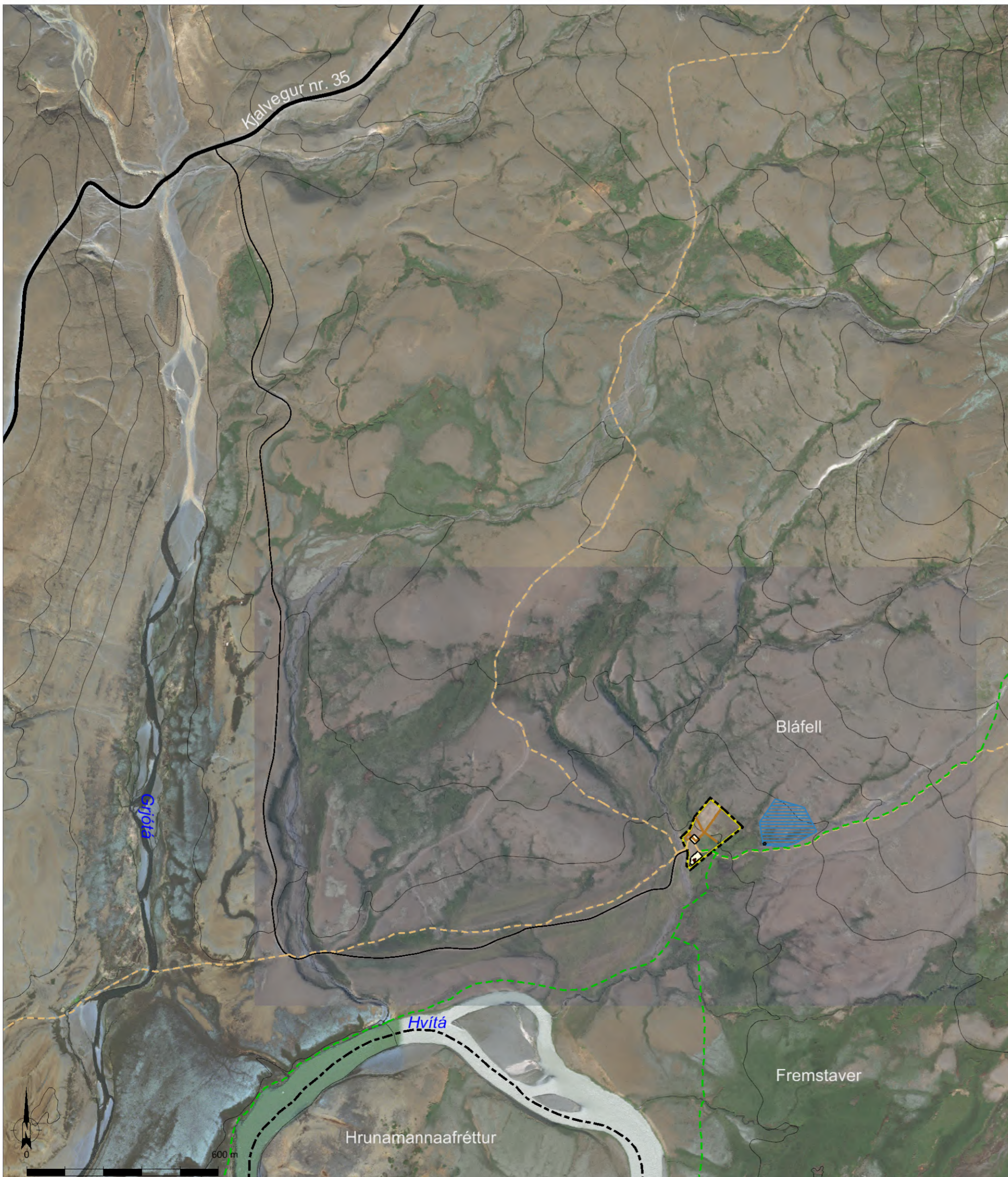
Skýringaruppráttur í mkv. 1:12.000.