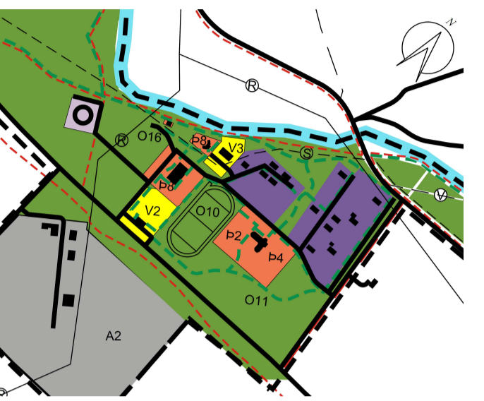
Aðalskipulag þéttbýlisupplýsingar fyrir Árnes 2004-2016 e.br. ekkí í kvæði

Samþykkt deiliskipulagsbreytingarinnar var auglýst í B-deild Stjórnartíðinda þann