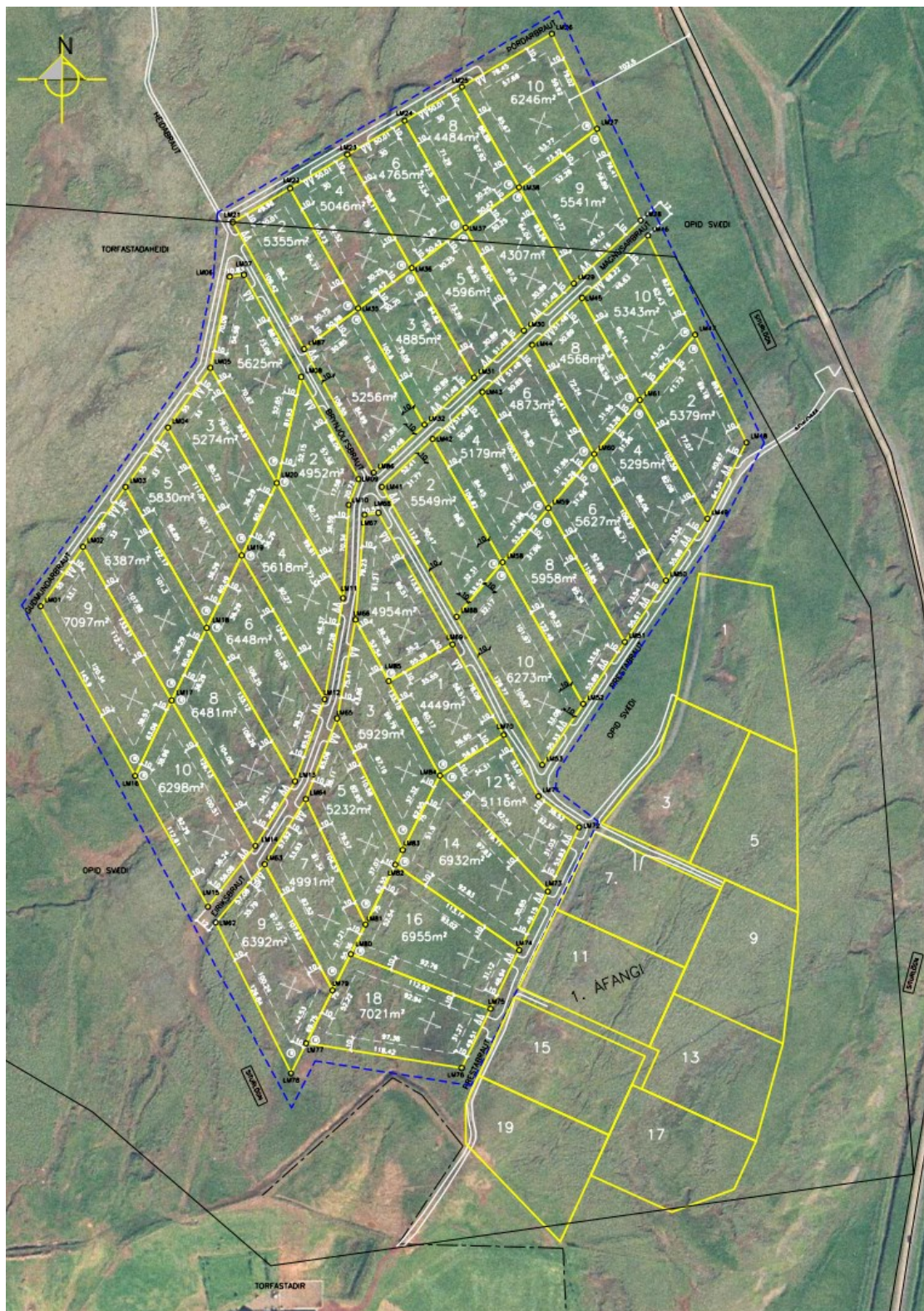
MYND 2. Gildandi deiliskipulag fyrir annan áfanga frístundasvæðisins F63 á Torfastöðum.

Deiliskipulag fyrir annan áfanga frístundasvæðisins er dagsett í apríl 2006. Gerðar hafa verið þrjár breytingar á því. Breytingarnar eru dagsettar í maí 2009, júní 2014 og maí 2017.