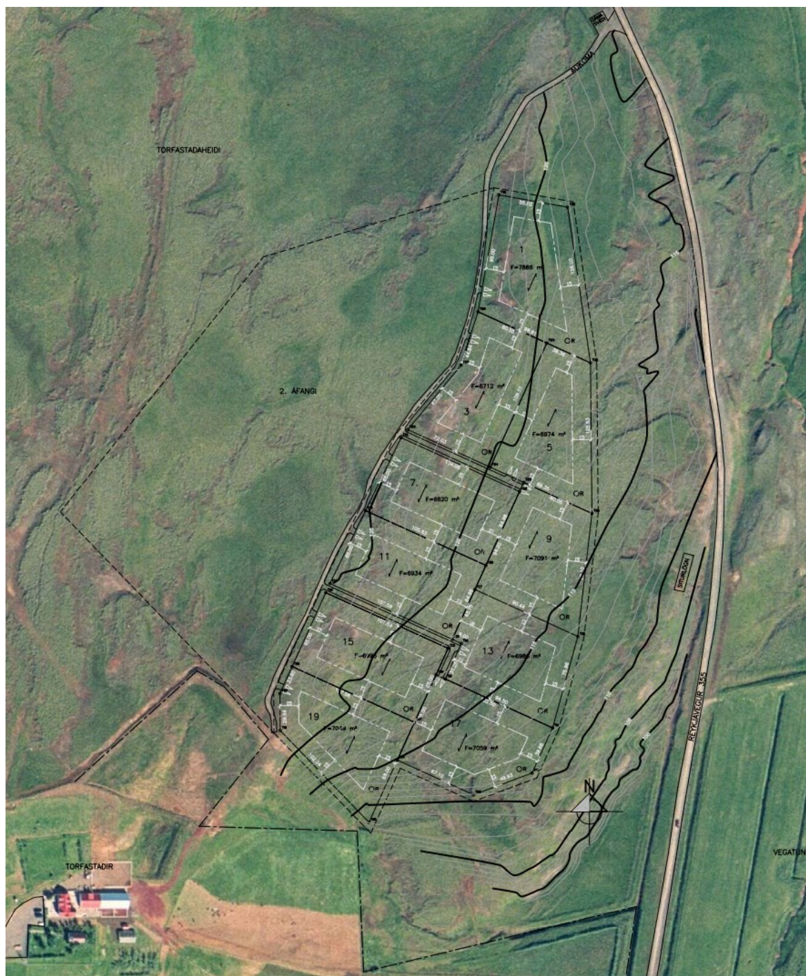
MYND 2. Gildandi deiliskipulag fyrir fyrsta áfanga frístundasvæðisins F63 á Torfastöðum.

Samkvæmt gildandi deiliskipulagi getur nýtingarhlutfall lóða verið allt að 0,03. Aukahús getur verið allt að 40 m 2 . Að öðru leyti en því sem fjallað er um hér aftar gilda skilmálar eldra skipulags með áorðnum breytingum.