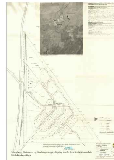
Deiliskipulag hannað af Birni Jóhannssyni landslagsarkitekt, samþykkt 3. júlí 2001

Að öðru leyti gilda áfram í breyttu skipulagi deiliskipulagsskilmálar í samþykktu skipulagi frá 3. júlí 2001 m.s.br.