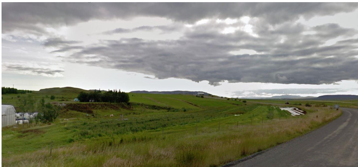
MYND 1. Hrafnkelsstaðir lóð 2..

Lóðin Hrafnkelsstaðir lóð 2 er að mestu ræktað land og er skilgreind sem landbúnaðarland í gildandi aðalskipulagi.