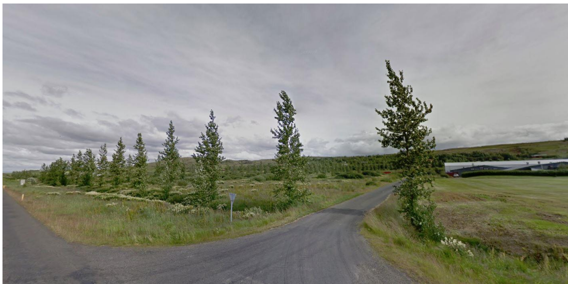
MYND 1. Garðastígur 8b. (Mynd: Googlemap.com).

Lóðin Garðastígur 8b er óbyggð að mestu gróin og er skilgreind sem landbúnaðarland í gildandi aðalskipulagi. Sunnan lóðarinnar, á lóðinni Garðastíg 8, er fyrirtækið Flúðasveppir með starfsemi sína.