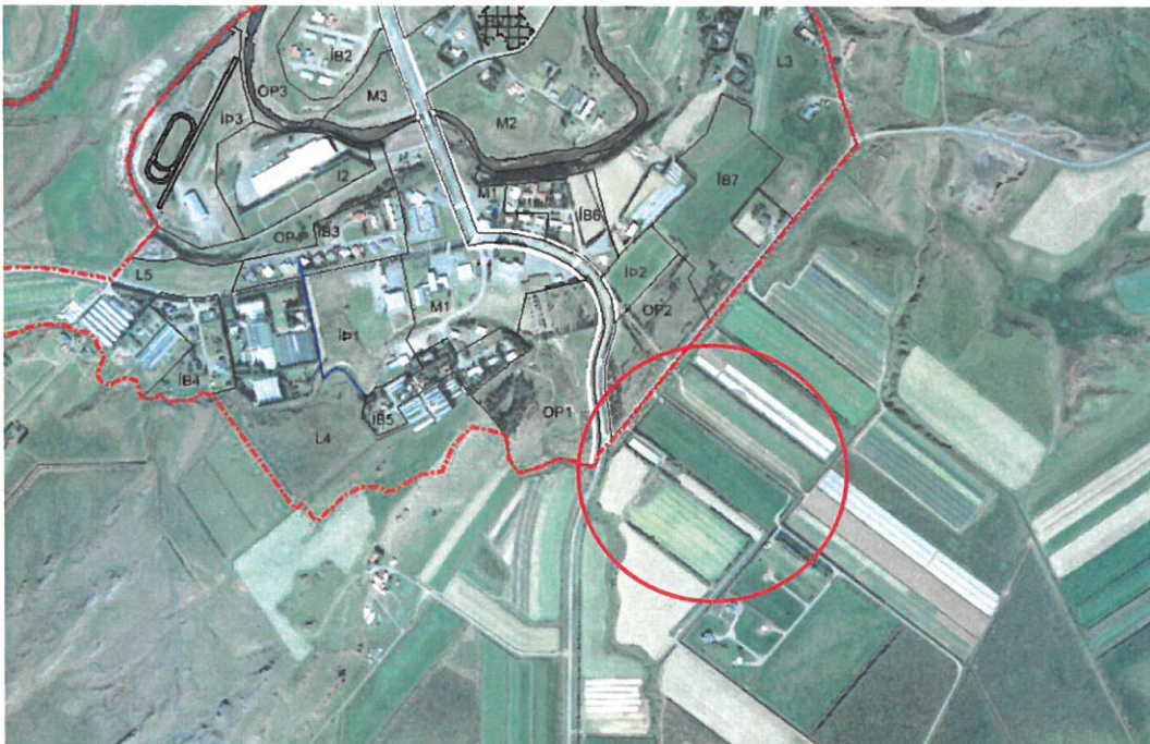
MYND 1. Flúðir – Þéttbýlismörk rauður rammi. Fyrirhuguð breyting er mörkuð með rauðum hring.

Lóðin Grafarbakki II spilda 1 er um 9.7 ha að stærð í heild sinni. Stærð norðurhluta lóðarinnar, þess svæðis sem breytingin nær til, er um 26.000 m 2 . Um er að ræða sléttlent ræktað land, skilgreint sem landbúnaðarland í gildandi aðalskipulagi. Að auki er það flokkað sem gott akuryrkjuland. Syðri hluti lóðarinnar tilheyrir skilgreindu frístundasvæði (F14).