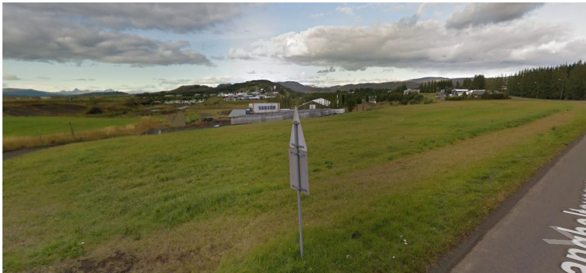
MYND 1. Ræktað land næst Langholtsvegi. (Mynd: googlemap.com).

Lóðin Sandskarð er gróin, að nokkru ræktað land. Frá Langholtsvegi hallar landið til norðurs, niður allbrattan mel og nær yfir fyrrum áreyrar í gömlum farvegi Litlu-Laxár. Ekki er gert ráð fyrir að fyrirhugað íbúðarsvæði nái niður fyrir melinn.