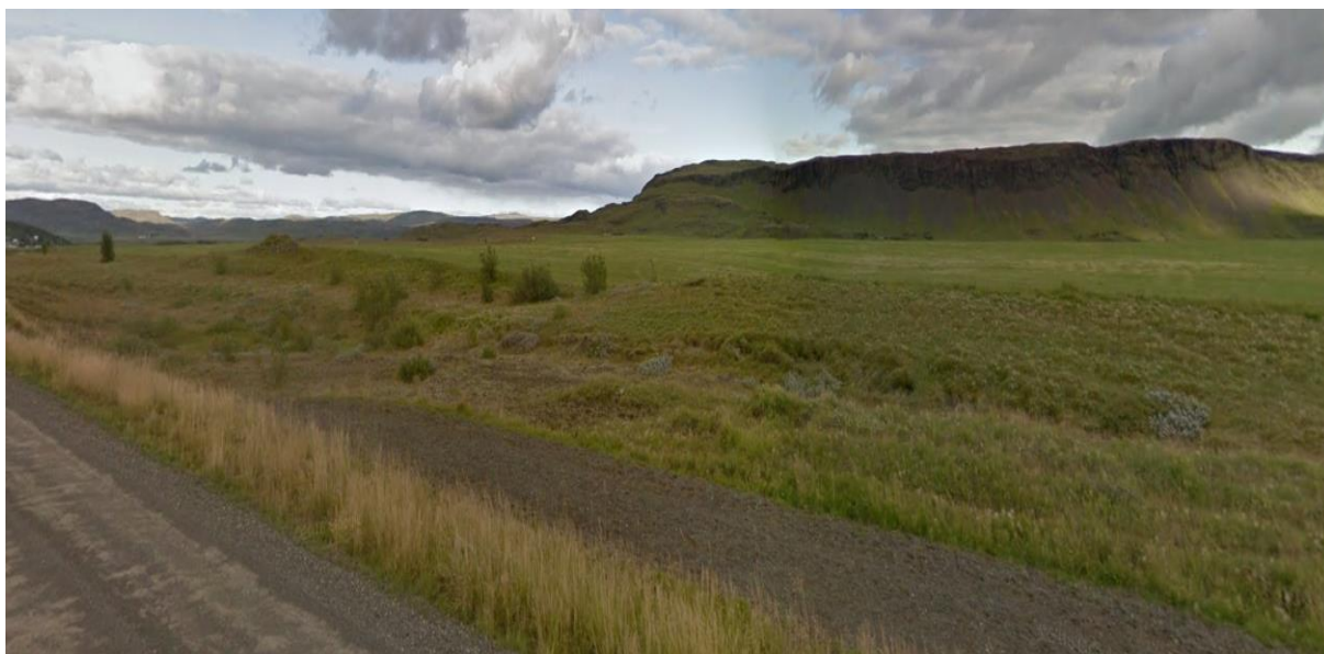
MYND 1. Fyrirhugað frístundasvæði. (Mynd: googlemap.com).

Aðkoma að svæðinu er frá Langholtsvegi nr. 341.