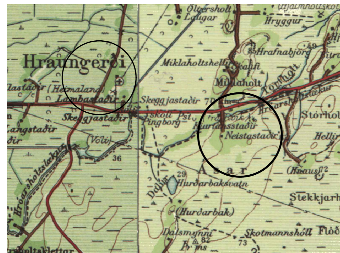
Úr aðalskipulagi fyrrum Villingaholtshrepps 2006 - 2018