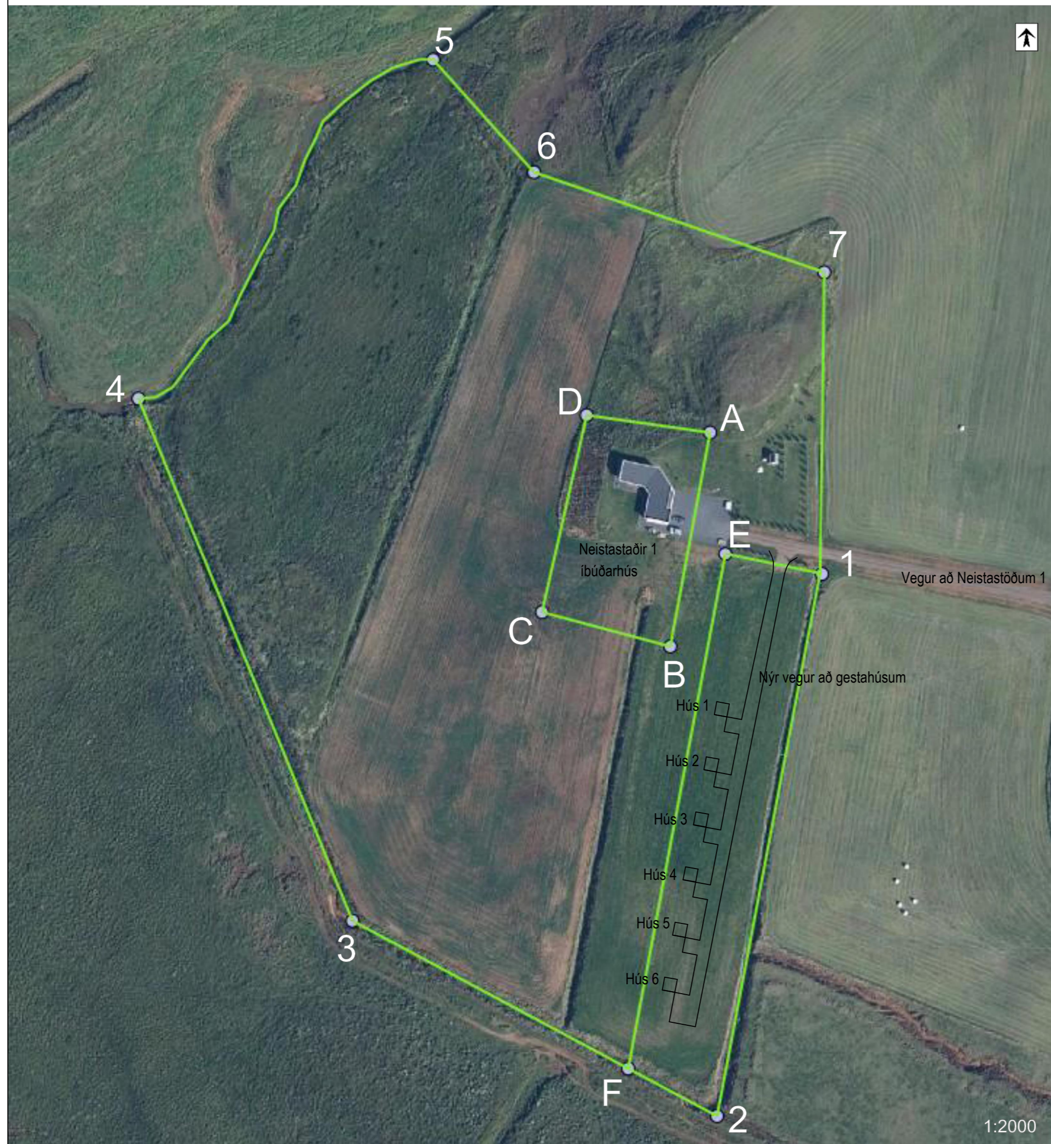
Deiliskipulag landspildu mk. 1:2000