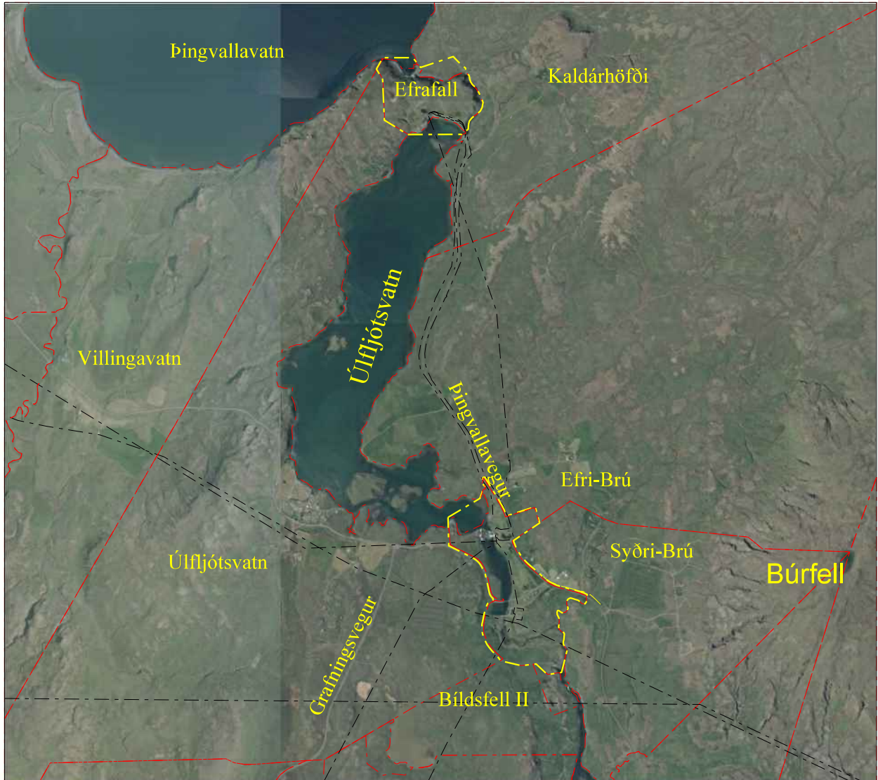
Skipulagssvæðin eru sýnd með gulri línu.