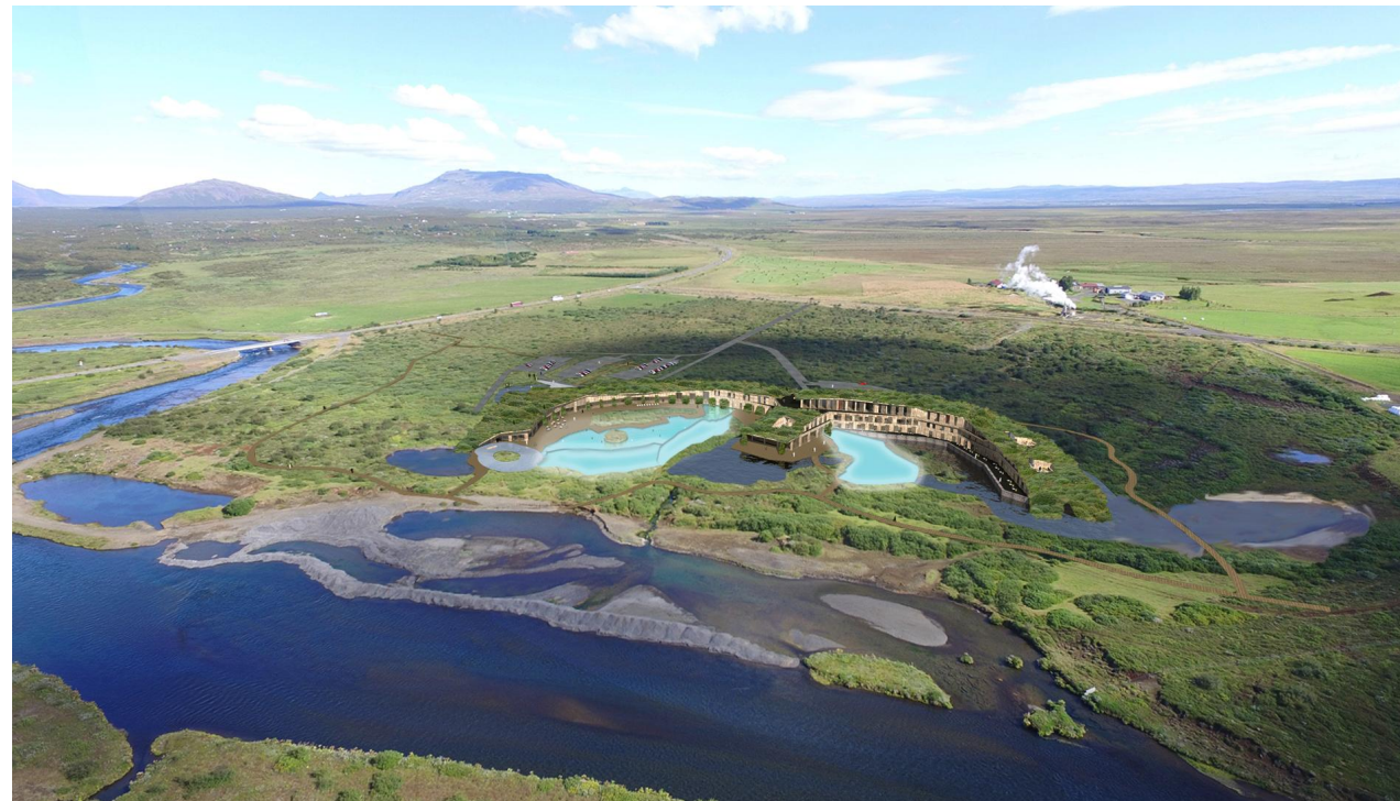
Skýringarmynd: Tilaga að byggingu og lónum. Árbakki verður lagfærður í samráði við Umhverfisstofnun og Fiskistofu